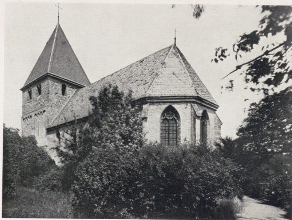
Köln — Niehl. Ehemalige Pfarrkirche. — Turm erste Hälfte 12. Jahrhunderts, Langhaus 14. Jahrhundert.

Der kleine Ort Niehl, aber er wird bald eine Bedeutung erhalten, die er sich nie hat träumen lassen und die ihn aus seinem stillen Idyll, fern der Großstadt, aufrütteln wird. Der Lärm der Maschinen am Strom ist erstes Anzeichen der Dinge, die da kommen. Kölns bisheriger Hafen zwischen Bayenturm und St. Mariä-Lyskirchen ist nicht mehr ausdehnungsfähig, weder für Lagerräume noch für Eisenbahnanschlüsse, aber auch nicht die Häfen zu Deutz und Mülheim. Niehl ist als großer Hafen ausersehen worden. Ein Blick auf die Karte zeigt uns, was hier im Entstehen begriffen: ein breites Hafenbecken längs des Stromes. Von dort aus seitlich vier ebenso breite in das Land hinein. Dahinter der geplante Hafenbahnhof, ein Gemeinschaftsbahnhof vieler Interessen, denn dort werden Verbindungen ausstrahlen zur geplanten Schnellbahn nach Düsseldorf, nach Nippes und Ehrenfeld, zur Gürtelbahn in das Braunkohlengebiet, vor allem nach Worringen. Zwischen