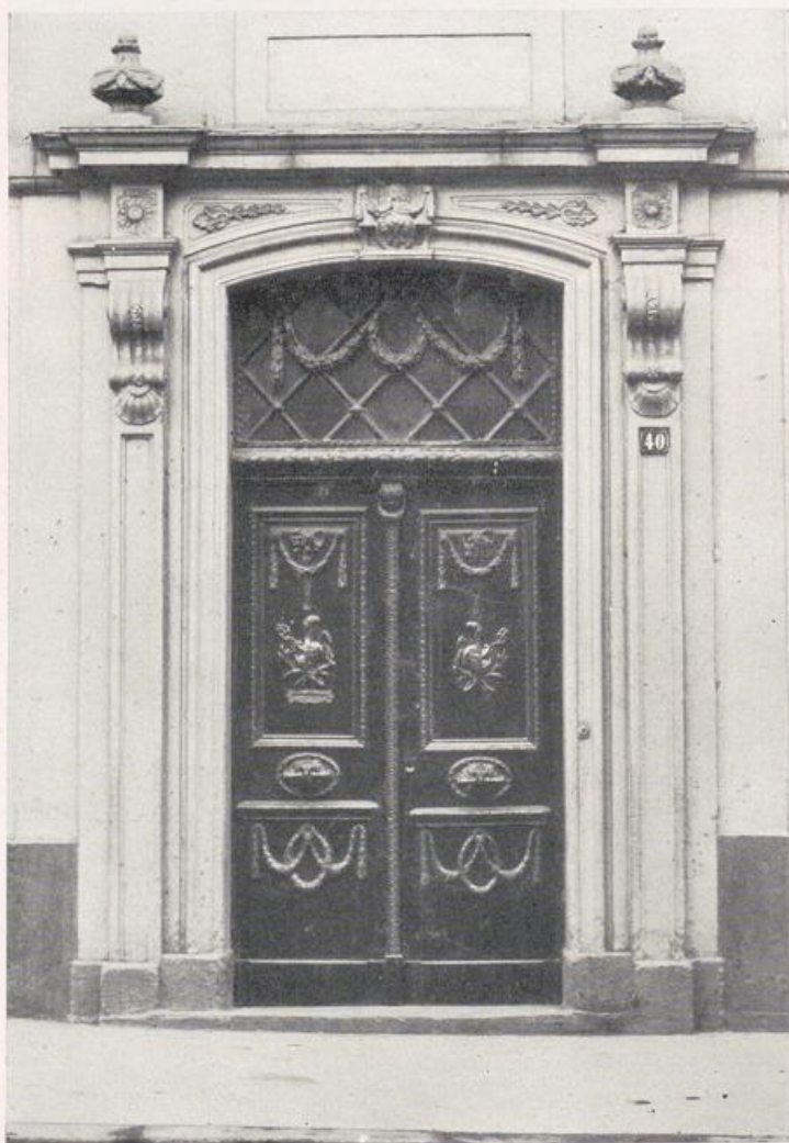
Köln — Mülheim. Portal Freiheit Nr. 40.

Gegen den Strom vorragend, auf ummauerter Anhöhe die alte Pfarrkirche des heiligen Clemens (Bild S. 29 a). Inschriften erzählen, daß sie in den Jahren 1692 und 1720 erbaut worden ist, die Vorhalle vor der Westfassade am Rhein 1754. Die Lage des Tur-