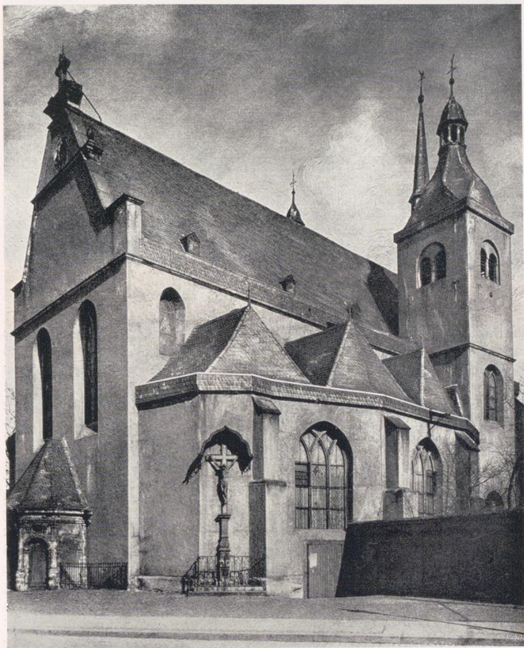
Köln — Deutz.

St. Heribert nach dem Neubau zwischen 1640 u. 1672.