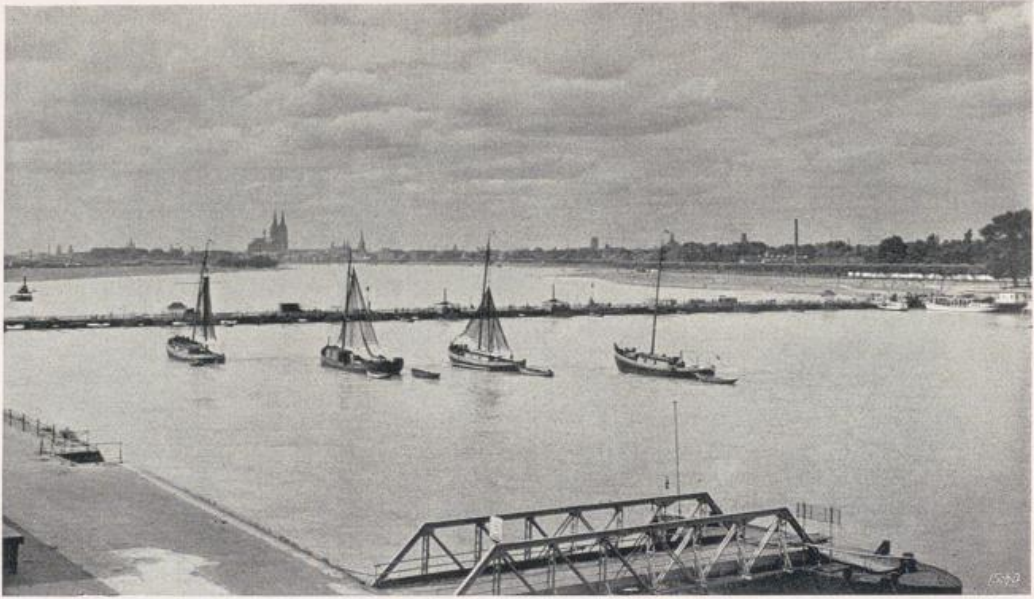
Köln — Mülheim.

Schiffsbrücke. Im Hintergrunde der Dom zu Köln. — Fortsetzung des Bildes S. 29.