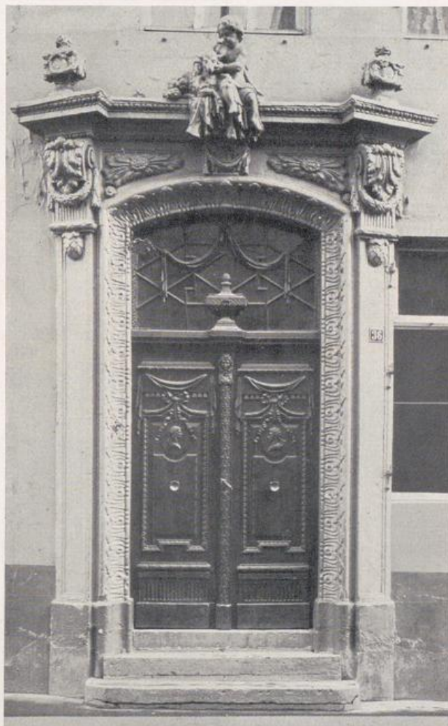
Köln — Mülheim.

Die „Mülheimer Freiheit“ läuft stromabwärts in das „Stammheimer Ufer“ über. Dicht am Strom zieht sich die Uferstraße weiter bis zu dem Orte Stammheim, der 1914 ebenfalls eingemeindet wurde. Mit-ten in diesem Ort öffnet sich ein ausgedehnter Park prächtigen alten Baumbestandes zum Rhein, mit ihm ein Schloßbau (Bild S. 32). Stammheim war schon im 10. Jahrhundert Königlicher Hof, kam dann als Geschenk des Erzbischofs Bruno von Köln an die Abtei Groß St. Martin. Seitdem hat Stammheim oft seinen Besitzer gewechselt. Im 12. Jahrhundert wird ein Geschlecht der Ritter von Stammheim genannt. Im 17. Jahrhundert sitzen die Herren von Diependal, im 18. Jahrhundert die Herren von Weyhe und die Herren von Pfeil auf Stammheim, seit 1818 die Freiherren, späteren Grafen von Fürstenberg-Stammheim. Das heutige Herrenhaus erstand in der zweiten Hälfte des 18. Jahrhunderts. Hufeisenförmig schließen sich nach dem Rhein zu zweistöckige