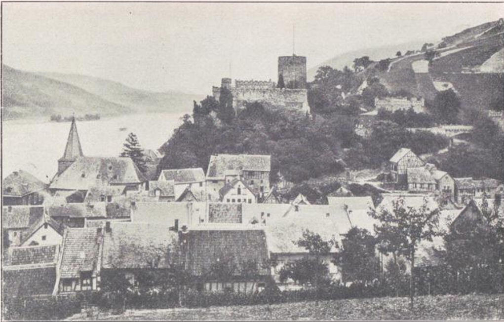
Niederheimbach mit Burg Heimburg oder Hohnneck. Vgl. die Angaben Bild S. 90 a.