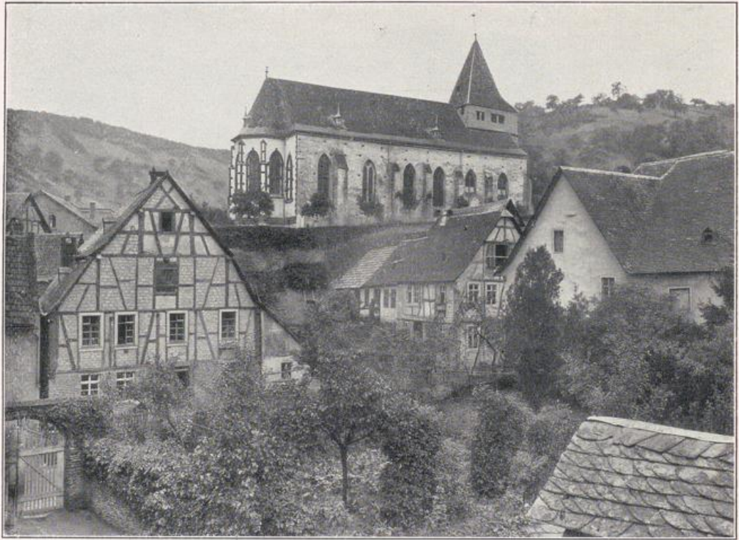
Oberdiebach. Hallenkirche eines ehemaligen Chorherrenstiftes, 15. Jahrh.