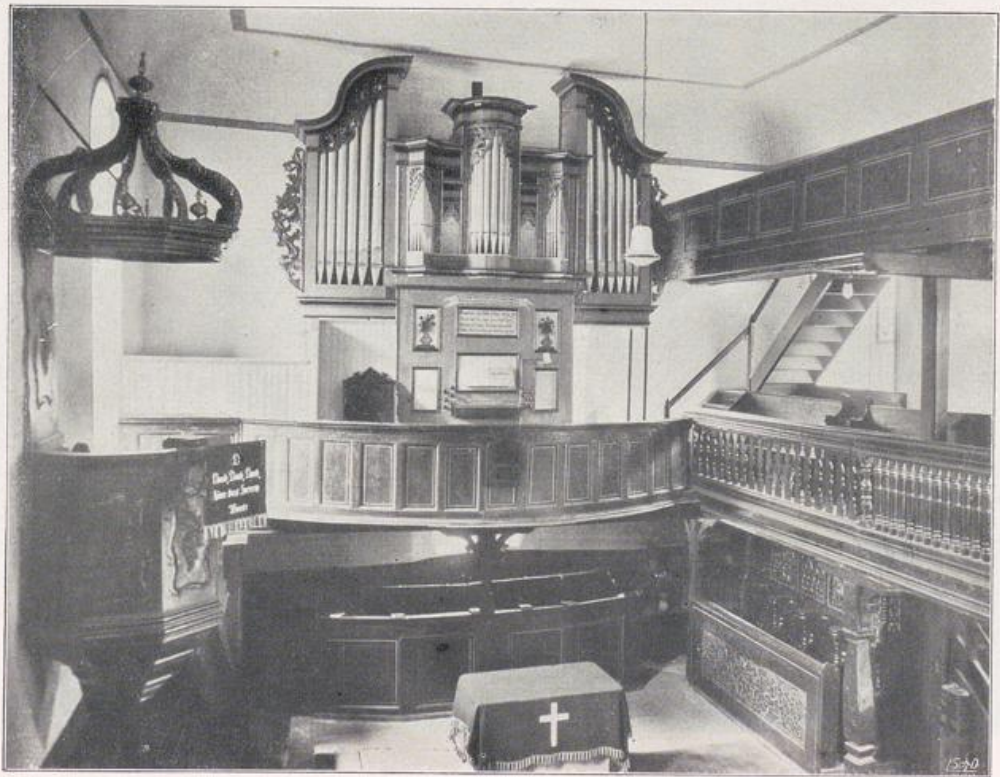
Manubach. Evangelische Kirche. Gegenüber liegende Emporen s. Bild S. 93.