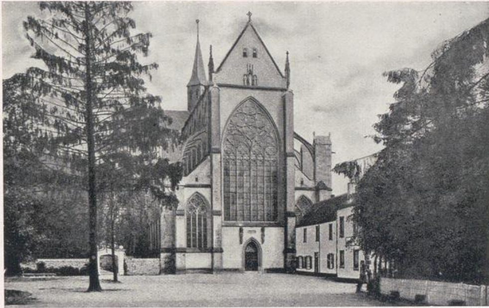
Dom zu Altenberg. Westfront. Vgl. Bild S. 38.

regeln der Cisterzienser, nur ein Dachreiter über der Vierung, wie bei der Ordenskirche zu Eberbach (I, S. 46).