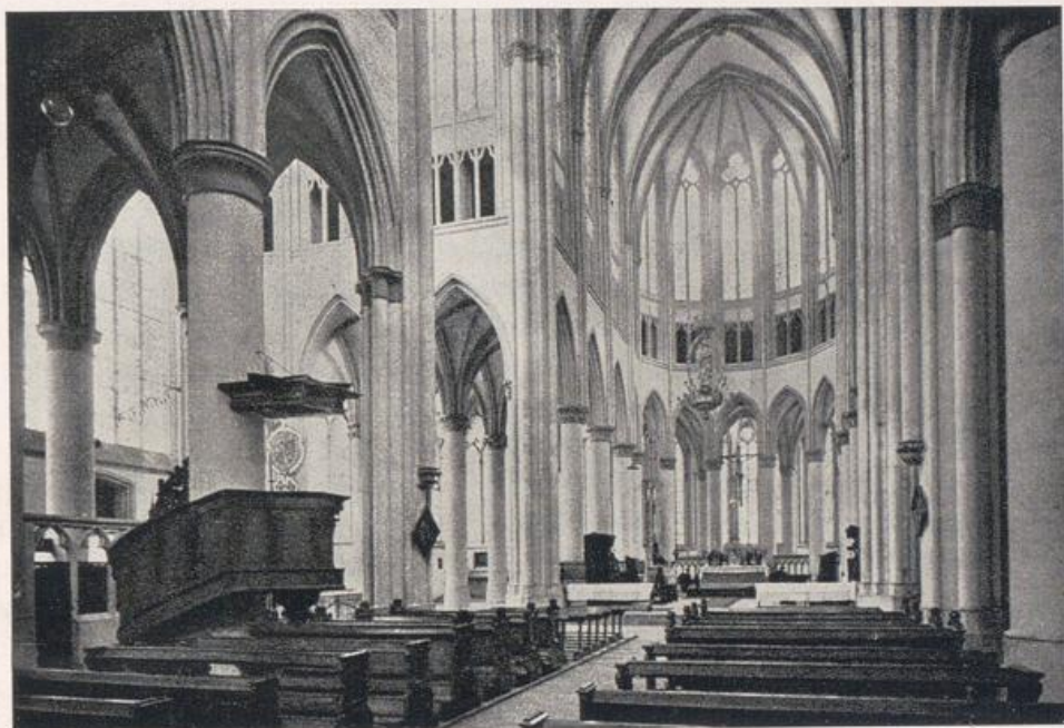
Dom zu Altenberg. Blick auf das Ostchor.