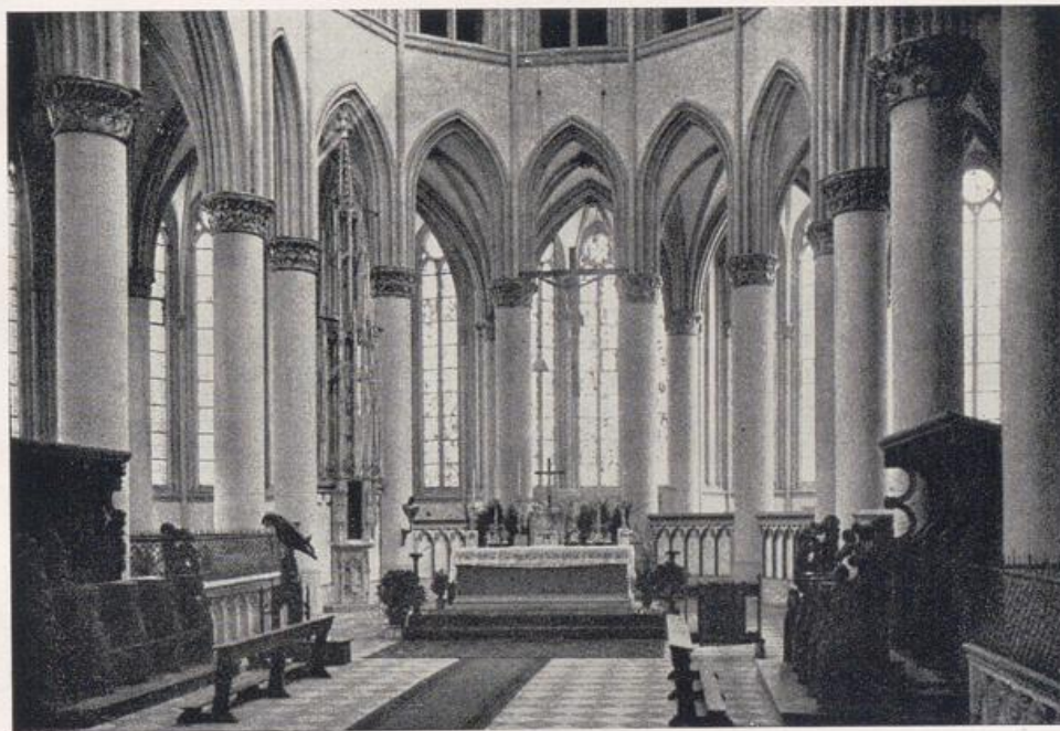
Dom zu Altenberg. Das Ostchor. Vgl. Bild S. 41 a.