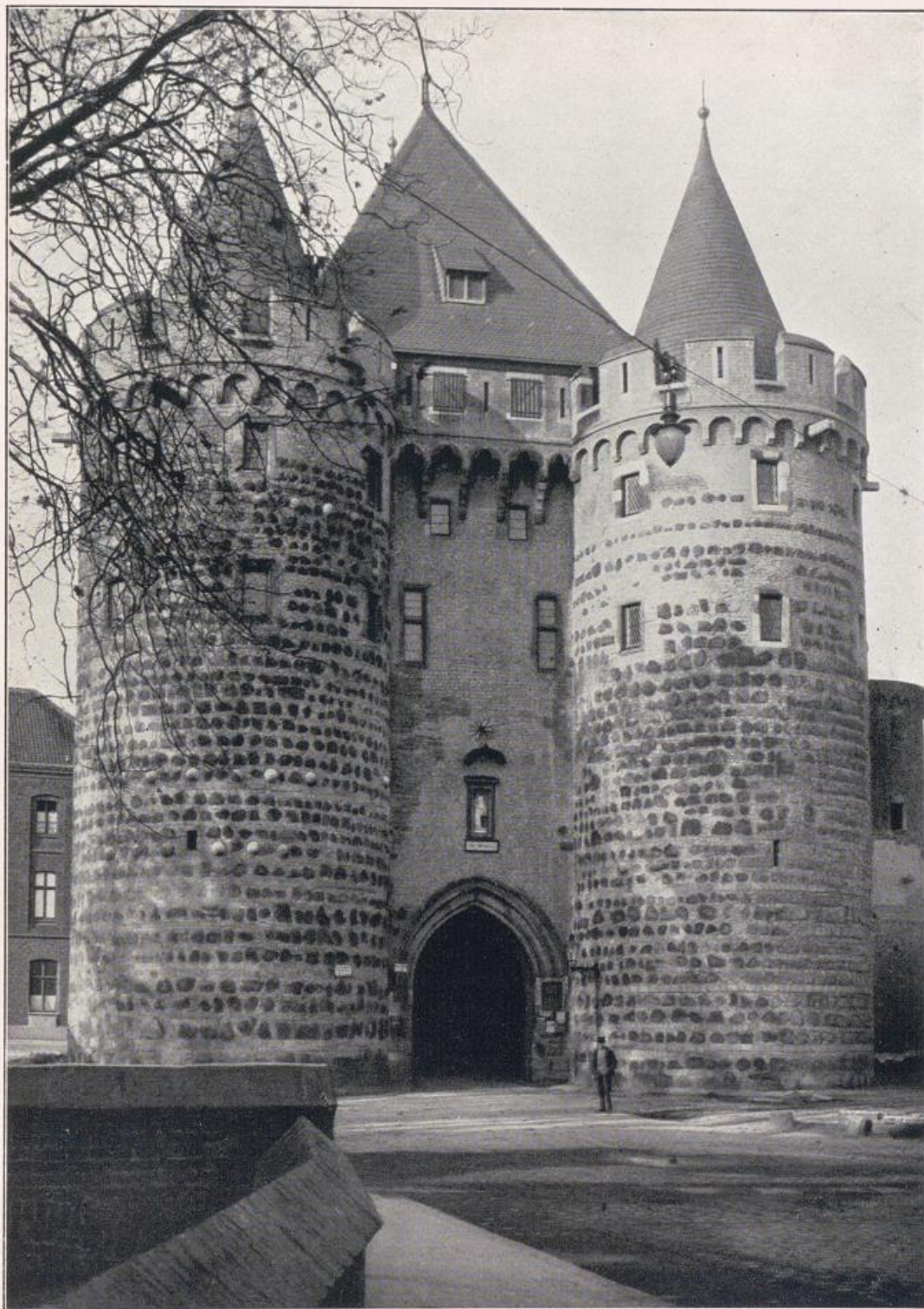
Das Obertor zu Neuß. Mitte 13. Jahrhunderts erbaut.