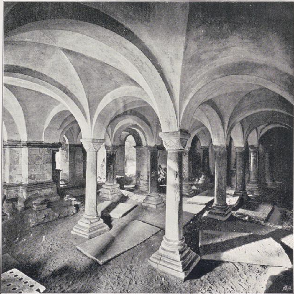
St. Quirin in Neuß.

Endzweck zu sein; und dennoch bleibt er klar im Aufbau des architektonischen Gerüsts. Darüber, gleichfalls viergeschossig, der Turm aufragend, kühn, selbstbewußt, und wieder eigenartig selbständig in der Verwendung seines Bauschmuckes. Im Inneren schwer noch die Formen der Arkaden und Emporen und dämmerig das Licht (Bild S. 86). Denkt man aber zurück an das Innere von St. Aposteln zu Köln (III, S. 109), welch ein ganz anderer Rhythmus durchflutet den Raum des heiligen Quirinus in Neuß, ein erstes Wehen frühgotischer Raumgebilde. Das bewirkt nicht allein das äußerliche Motiv der Spitzbogen der Arkaden der Seitenschiffe und Emporen. Hier redet, ohne daß es auffällt, ein raffinierter Trick mit: die Tiefe der Mittelschiffsgewölbe nimmt ab nach dem Chor zu. Der Erfolg: eine künstlich gesteigerte Tiefenwirkung, ein Mittel, das wieder an spätere Barockzeit erinnert. Dazu kommt noch die Verschiedenheit der Arkaden und Fenster in Form und Maßen. Aber trotz all dieser seltsamen