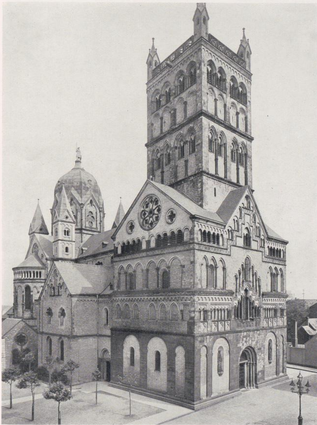
St. Quirin zu Neuß.

Neubau begonnen 1209 von Meister Walbero. Die barocke Chorturmkupele nach dem Brande von 1741.