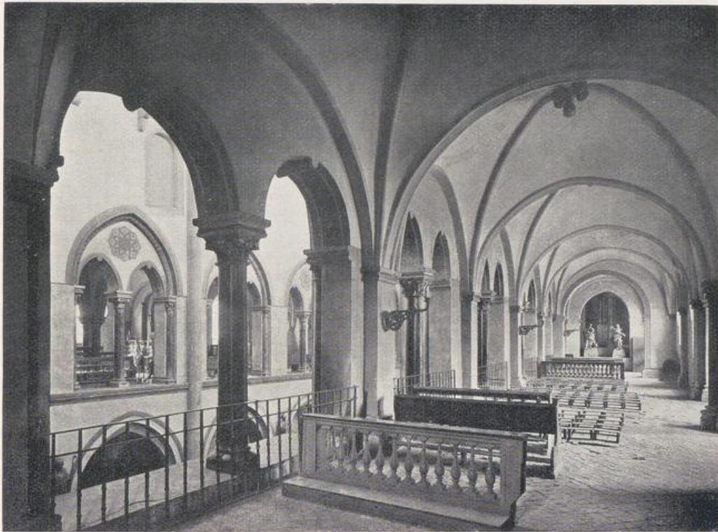
St. Quirin in Neuß.

Blick aus den Emporen in das Mittelschiff. — Vgl. Bild S. 86.