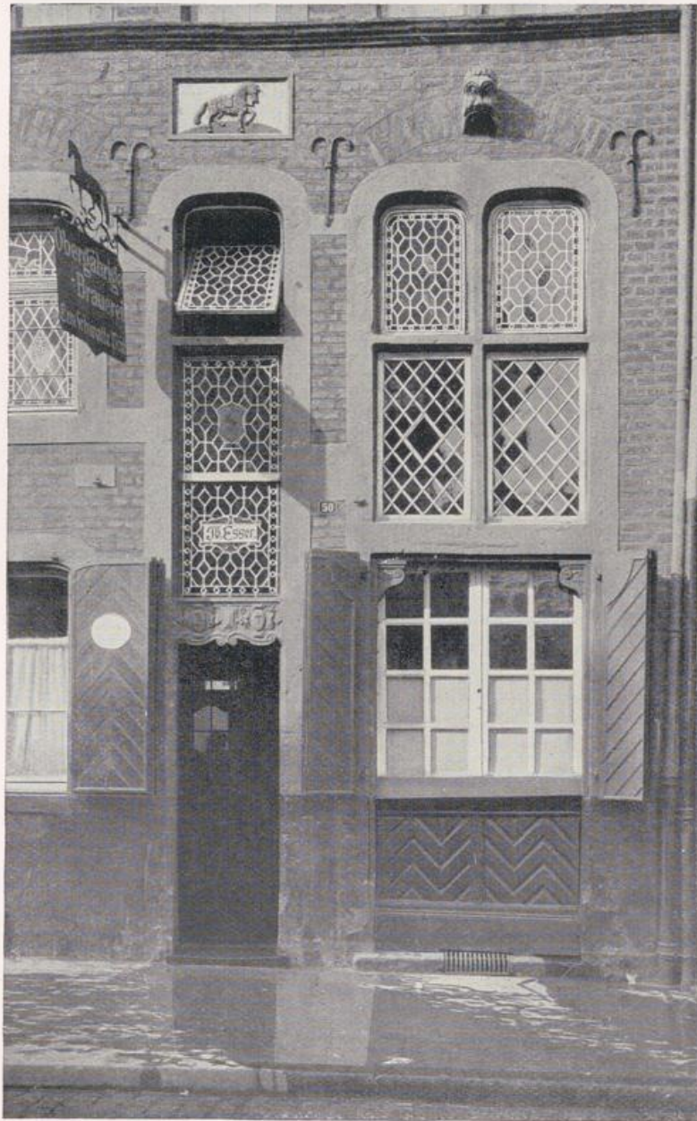
Neuß. Brauerei „Zum Schwatten Rosz“.

Der Neubau, 1634 bis 1638, in Jahren drückender Not erstanden, wird von der neuen Fassade des 18. Jahrhunderts nicht ganz verdeckt und lugt noch mit seinen Ecktürmchen und seitlichen Treppengiebeln auf das Marktplatztreiben herab und hinüber an das Ende des Marktplatzes, wo die ehemalige Observantenklosterkirche, heute das gemütlich hergerichtete Städtische Trink- und Festhaus sich erhebt (1637—1639). Die breiten, schlichten Formen, die hochgezogenen Blenden,