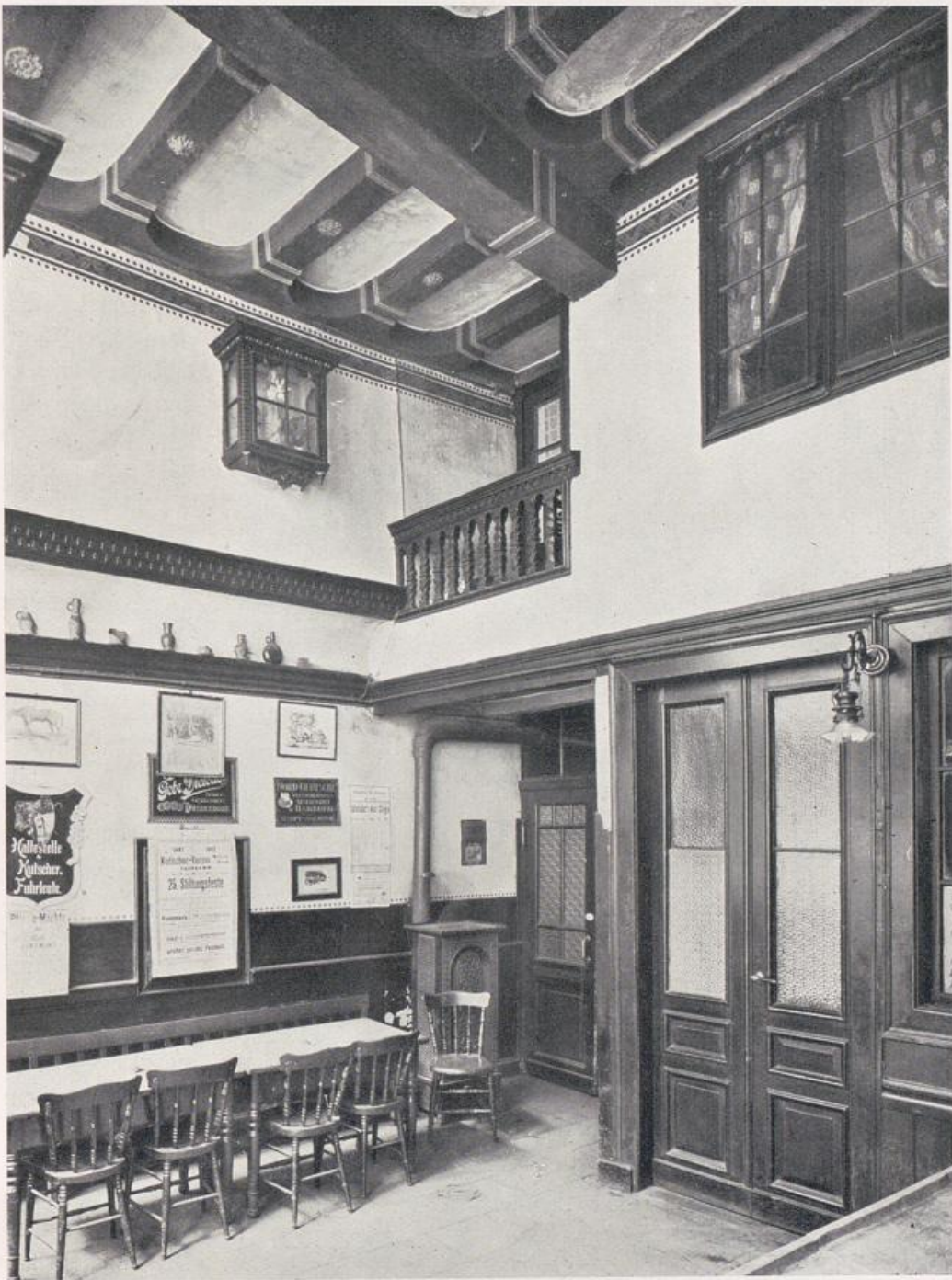
Neuß. Brauerei „Zum Goldenen Stern“.