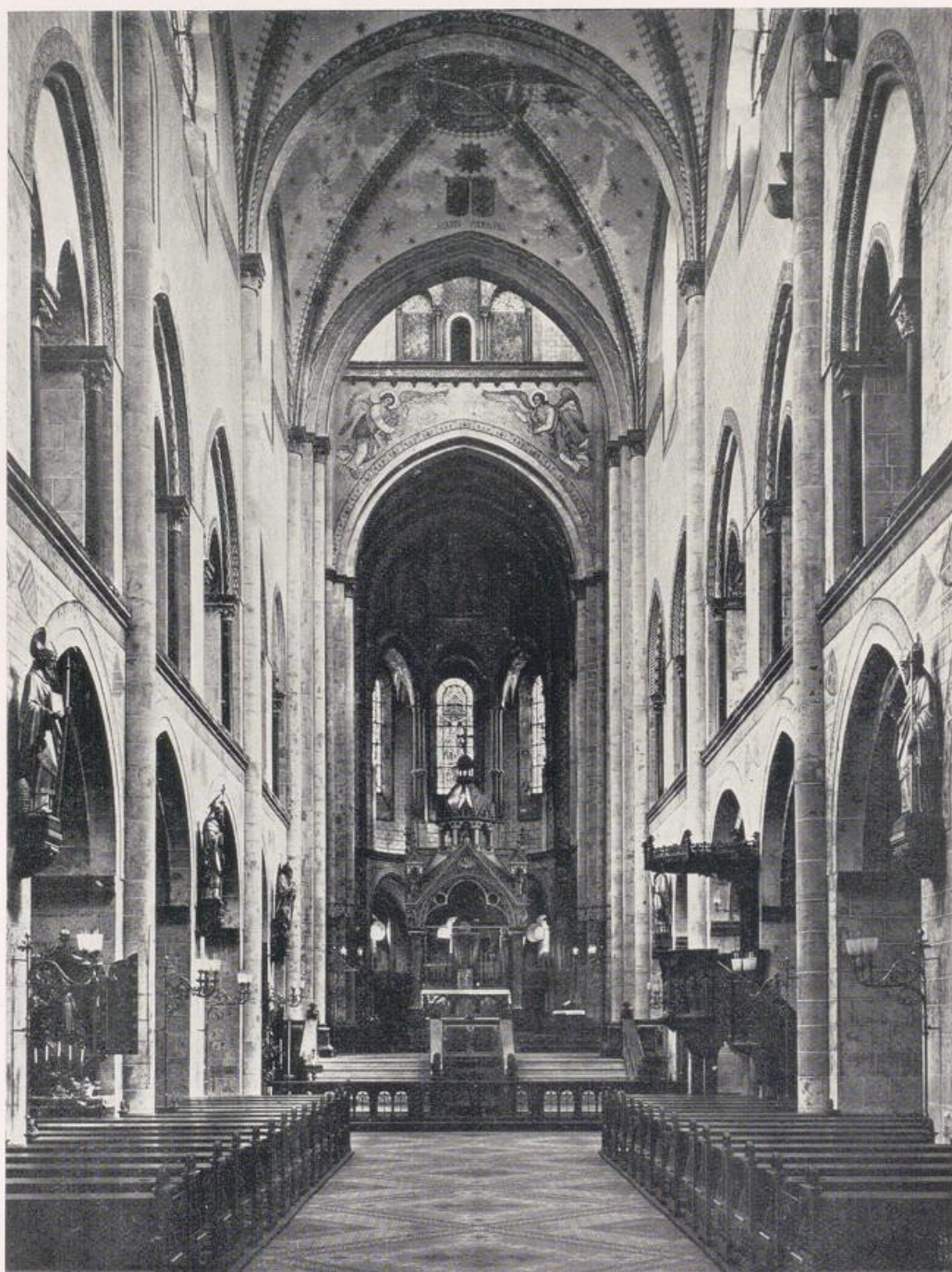
St. Quirin in Neuß.

Die starke Tiefenwirkung wird erzielt durch Verringern der Stützenabstände nach dem Chor zu.