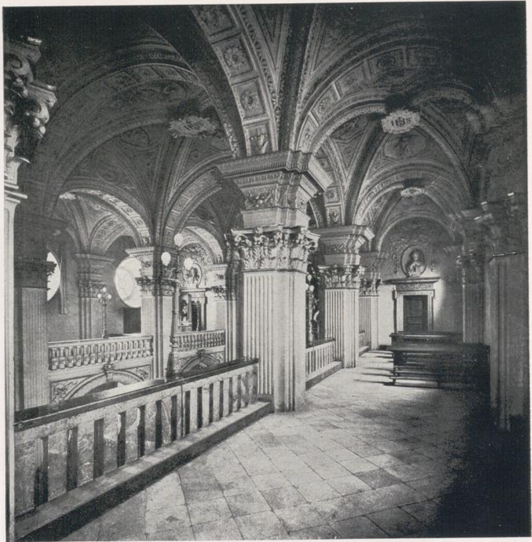
Düsseldorf. — St. Andreas. Blick aus den Emporen. — Vgl. Bild S. 97.

Grabeskapelle erbaute. Dort ruht auch Düsseldorfs großer Wohltäter, Wolfgang Wilhelms Enkel, Kurfürst Johann Wilhelm (1690—1716), in einem prächtigen Sarkophag, den Purpurmantel, Kruzifix und Medaillonreliefs bedecken. Sein Vater Philipp Wilhelm (1653—1690), der Freund des Joachim von Sandrart und ein begeisterter Musikliebhaber, hatte vor den Toren der Stadt in Benrath ein interessantes Lustschloß gebaut. St. Andreas hatte einen weltlichen Bruder erhalten von gleicher Freude an süddeutsch-italienischen Formen. Italienische Stuckkünstler schmückten den Schloßbau auf das reichste aus. Von dem Bau ist aber nur noch die Orangerie erhalten, und zwar in einem höchst verwahrlosten Zustande. Und dennoch kann der Schmuck der Decken und Kamine davon erzählen, wie viel Schönheit Philipp Wilhelm hier ausgestreut hatte.