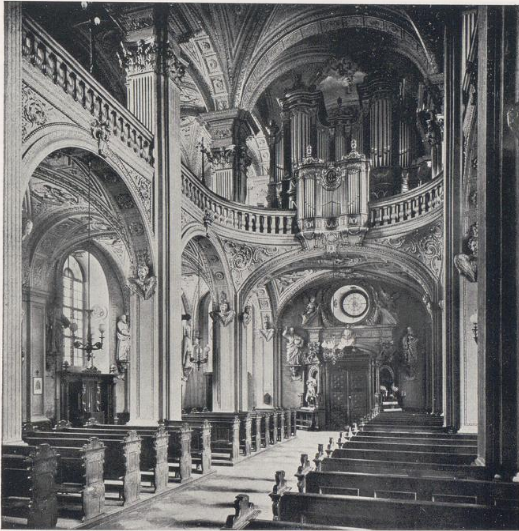
Düsseldorf. — St. Andreas.

Blick auf den Eingang. Stukkaturen von Johannes Kuhn 1632. — Vgl. Bild S. 98.