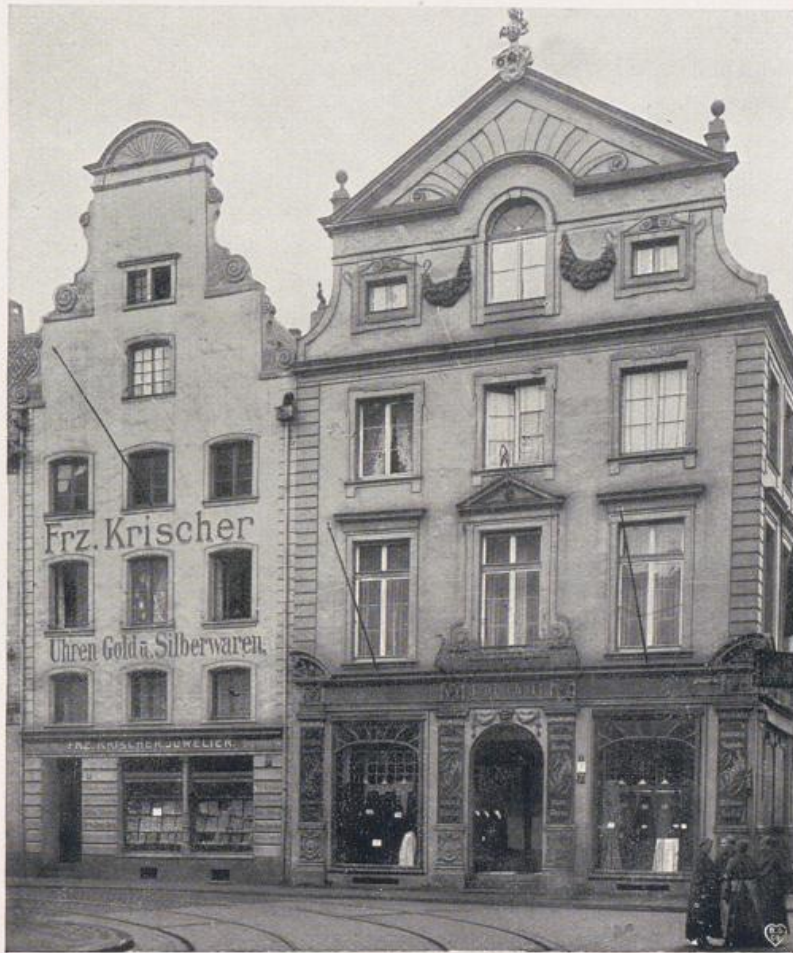
Düsseldorf. Häuser Ecke Flinger- und Marktstraße um 1700.

Diese neue Tonart vermittelte das erste große Baudenkmal des neuen Herrscherhauses, die Jesuitenkirche St. Andreas, und anschließend daran das monumentale Jesuitenkolleg (1622—1629; Bild S. 96). Es ist gar nicht auszumalen, wie seinerzeit diese malerische Baugruppe, die bis heute Düsseldorfs schönste Kirche geblieben ist, auf die Bewohner des kleinen Dorfes an der Düssel gewirkt haben muß! Über Manneshöhe der wuchtige Sockel; breite Wandpfeiler und stark verkröpfte Gesimse und Gebälke werfen belebende tiefe Schlagschatten über die Fassaden; die exakte Zeichnung der Fensterrahmen; schließlich der Aufbau der Chorpartie, die Verteilung der Nebenbauten, der Sakristei, der Grabeskappe und der Seitentürme um das Chor, dann das Innere der Kirche (Bild S. 97, 98). Wie im Außenbau so redet auch die Ausgestaltung des Inneren eine ganz andere Sprache als die ungefähr gleichalterige Jesuitenkirche zu Köln (Bild III S. 79ff.). Düsseldorf war nicht geschichtlich