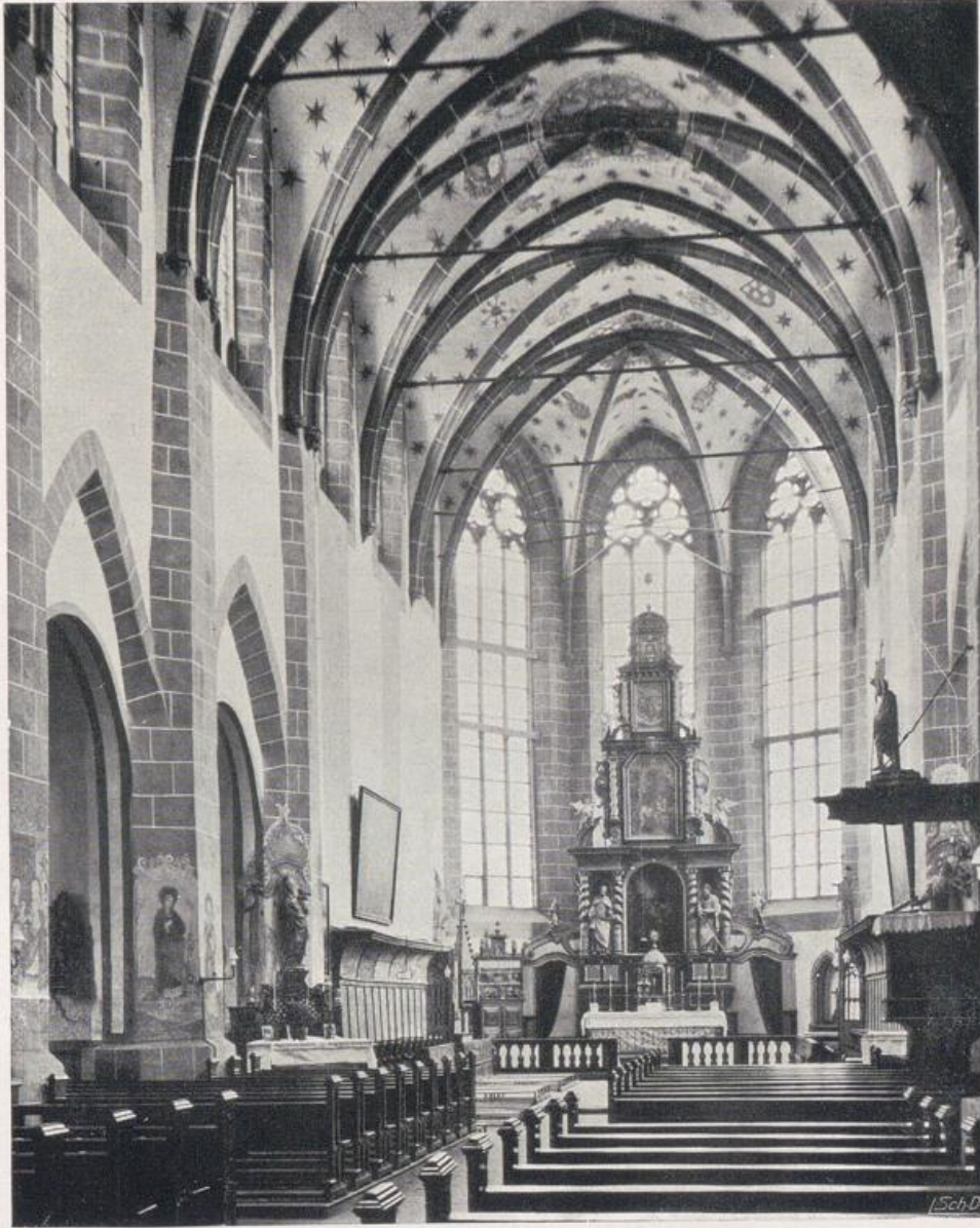
Oberwesel. St. Martin, Inneres (vgl. Bild S. 138, 139). — Hochaltar von 1682.