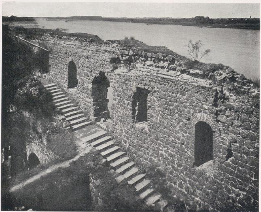
Kaiserswerth. Kaiserpfalz. — Vgl. Bild S. 115.

Von schweren Baumkronen umstanden, steigt neben der Ruine ein mächtiges Turmpaar auf, das weithin sichtbare heutige Wahrzeichen der Stadt und seines Schutzherrn, des hl. Suitbertus (Bild S. 117). Seit 1264 ruhen seine Gebeine in der Gruft der Kirche in einem Schrein, der zu den herrlichsten Schmelz- und Goldschmiedearbeiten der Rheinlande zählt. Kommt der Gedächtnistag der Überführung der Gebeine des Heiligen, dann strahlt der Platz um die Stiftskirche im Sommerglanz. Wehende Fahnen und Gesang begleiten den Zug mit dem Schrein Suitbertus'. Suitbertus ist Inbegriff der Stadt geblieben, er, der Stifter von Kaiserswerth, d. h. damals Suitbertiwerth genannt, der schon zu Anfang des 8. Jahrhunderts auf der Rheininsel eine Abtei gründete. Drei Jahre bevor die Grabesgruft der Stiftskirche des Heiligen Gebeine aufnahm, mußte der damalige Westturm zur Sicherung der Burg abgetragen werden. Man schmückte dafür die Westfront mit einem Dachreiter (Bild S. 114). Seit nun das Jahr 1702 dem Stadtbild den Burgfried der Pfalz genommen, war es des schönsten Schmuckes beraubt. Suitbertus' Grabeskirche mußte es neu beleben. August Rincklake führte von 1870 bis 1874 an der Westfront das Turmpaar auf. Bald darauf wuchsen die unvollendeten Chortürme nach. Hat der so feinsinnige Wilhelm Schäfer wirklich recht, wenn er in seinem