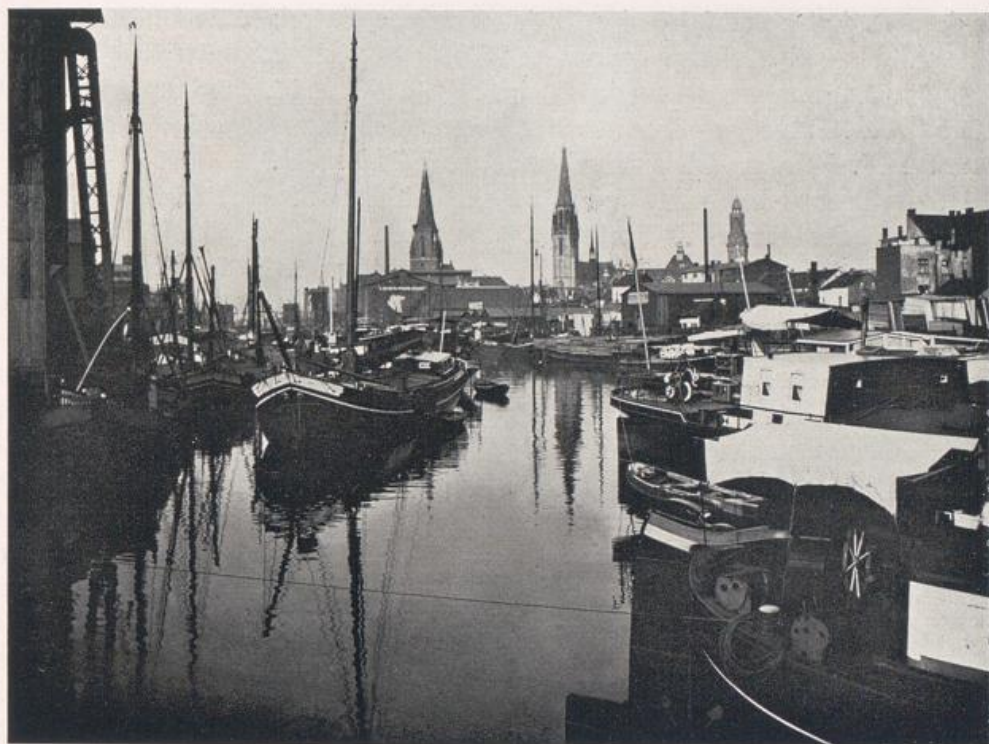
Der Duisburger Hafen.

Links im Hintergrunde die katholische Kirche. In der Mitte die Salvatorkirche. Rechts Rathausurm. Vgl. Bilder S. 140—143.