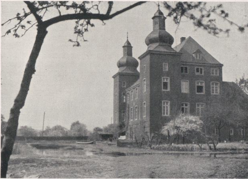
Haus Wohnung bei Götterswickerham. Zweite Hälfte 17. Jahrhunderts.