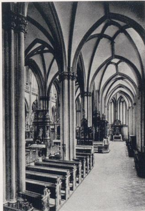
Viktorsdom zu Xanten.