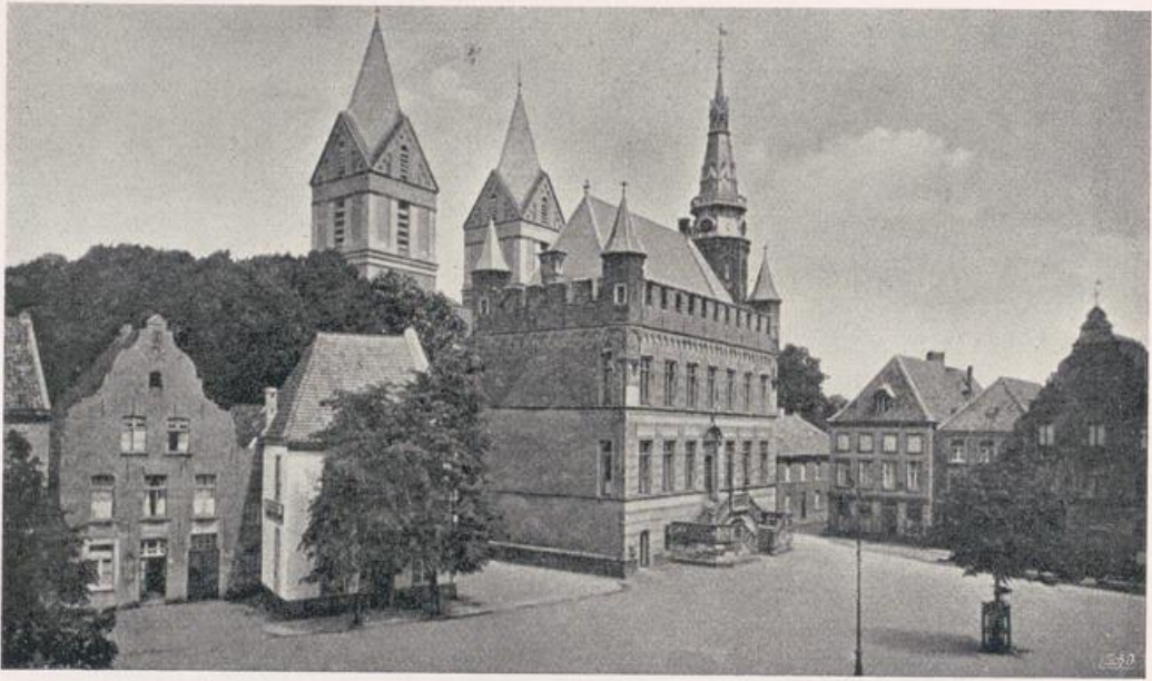
Rees. Rathaus und katholische Pfarrkirche. Heutiger Zustand.