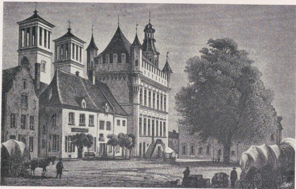
Rees. Rathaus (um 1450) und katholische Pfarrkirche (1812—1828) bis zum Jahre 1872.