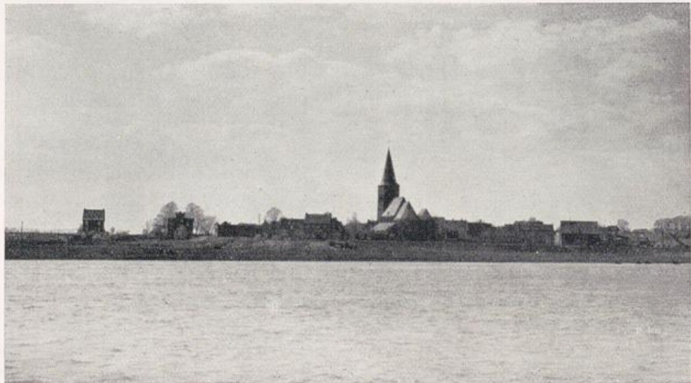
Grieth am Niederrhein.