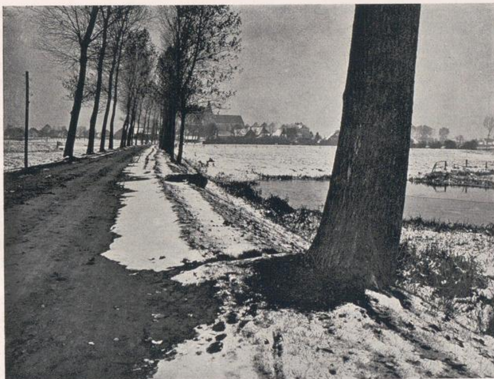
Weg von Kranenburg nach Zyflich.