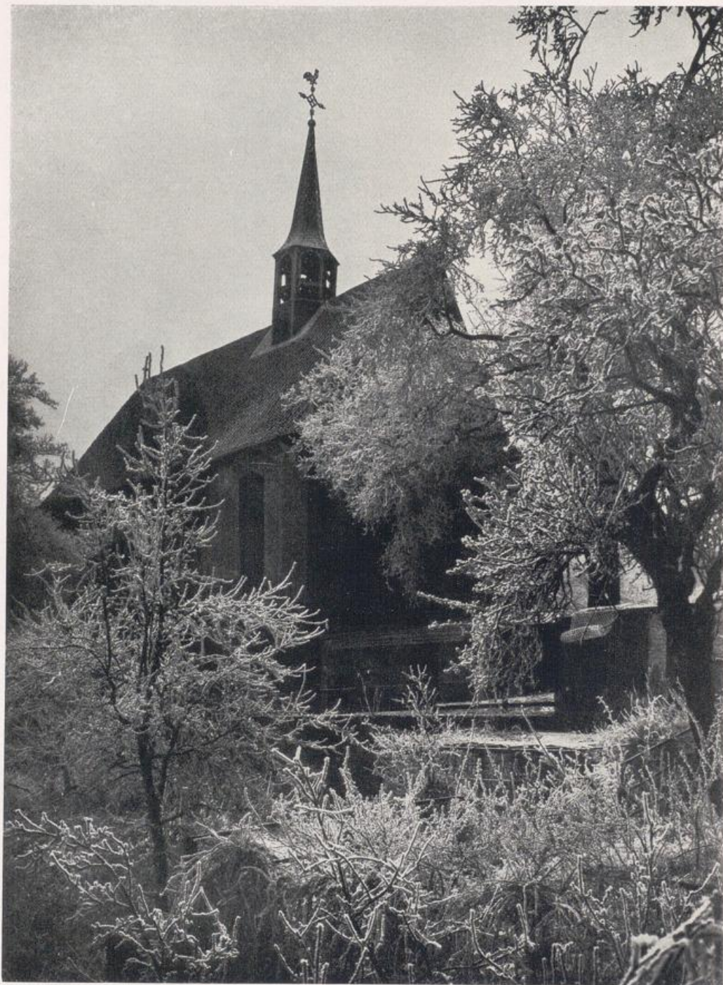
Kleve. Kleine Evangelische Kirche (1620).