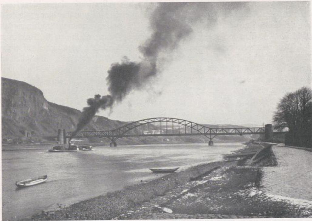
Erpeler Ley und Ludendorff-Brücke.

zum Buttermarkt, von dort als Neustraße zum Neutor, das mit seinem zwanzig Meter hohen Basaltquadermauerwerk über harmlose Fachwerkhäuser hinauswächst (Bild S. 104,2). Auch dieser Turm vom Beginn des 15. Jahrhunderts hat im 18. Jahrhundert ein neuzeitliches Dach erhalten.