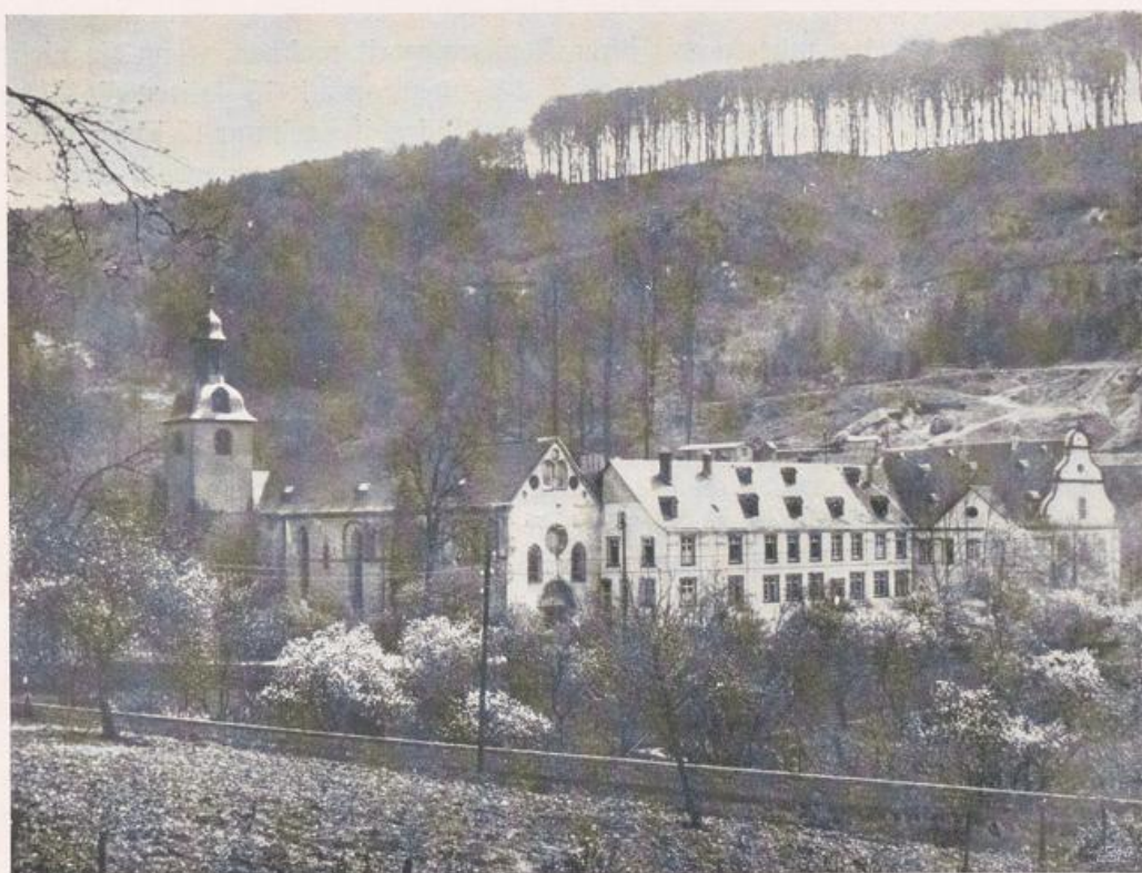
Sayn. Kirche und ehemaliges Prämonstratenserkloster. — Kirche 13. Jahrh. Kirchturm 1680. Klosterbauten 17. u. 18. Jahrh. (vgl. Bild oben).