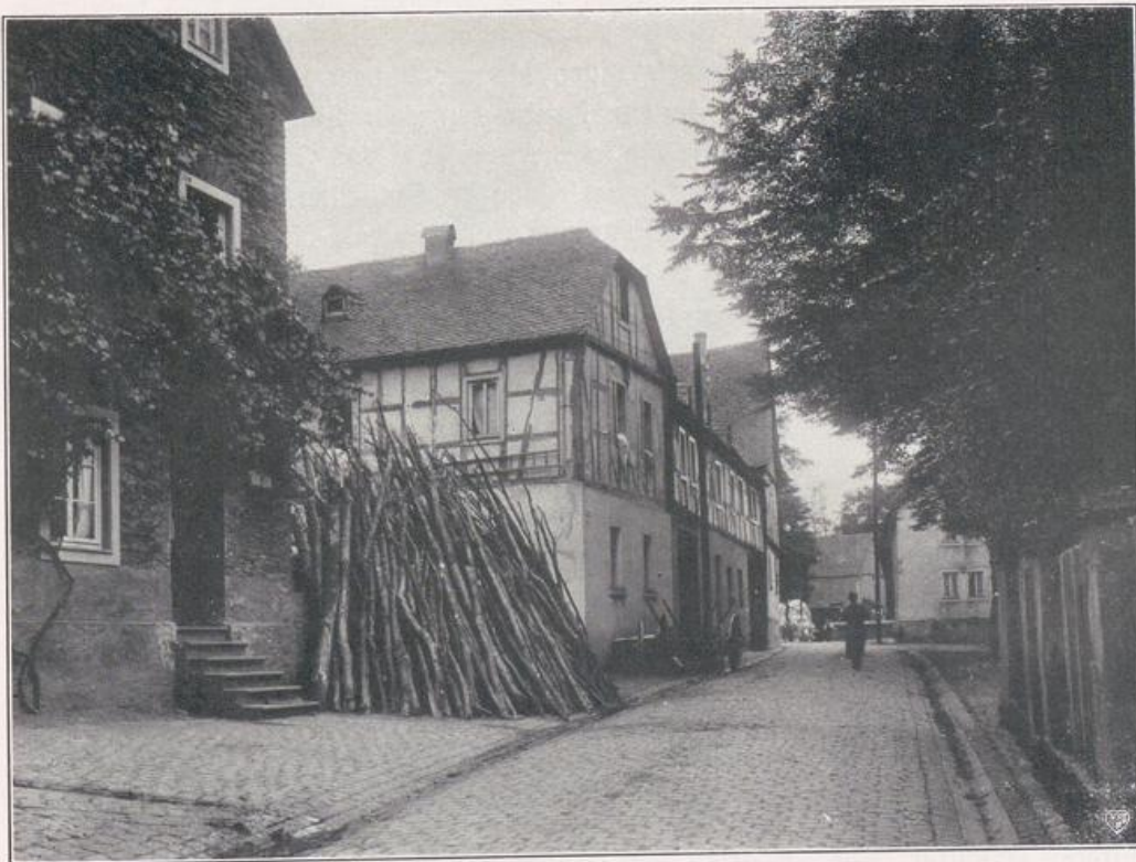
Altewied (vgl. Bild S. 63).

Ausgang der Stadtanlage war das Schloß. Vor ihm endigen die parallel laufenden Straßen, Rhein-, Kirch- und Engenser Straße, die rechtwinklig von den vom Rhein ausgehenden Querstraßen geschnitten werden, Friedrich-, Pfarr-, Mittel- und Schloßstraße. Die gleichförmige Planung verlangte gleichförmige Behandlung der Geschoß- und Profilhöhe, die Einförmigkeit hier und da natürlich von einem Monumentalbau oder einer Platzanlage unterbrochen. Aber leider haben sich zwischen