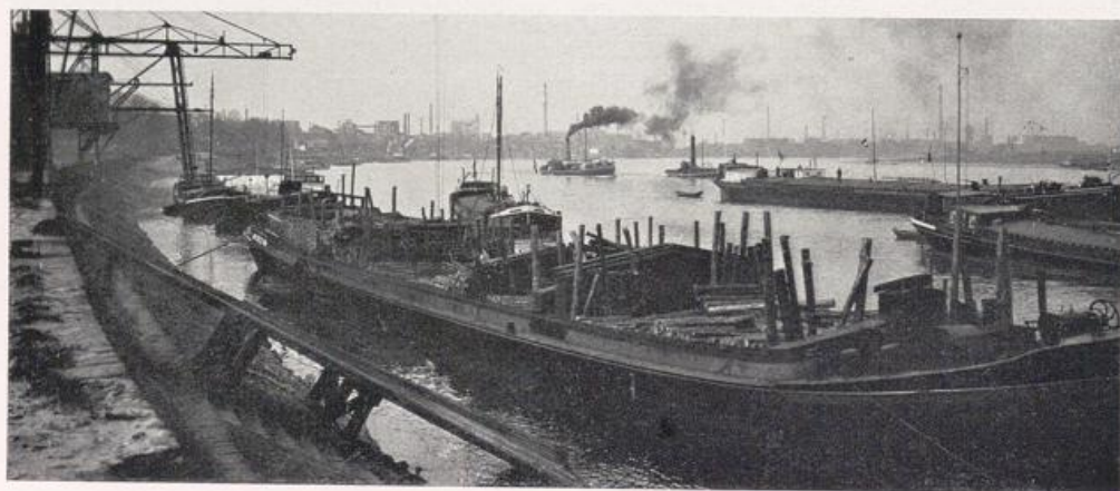
Blick aus dem Krefelder Hafen auf Ürdingen.

Dicht am Rhein vor dem Krefelder Hafen bauen sich die Hochöfen der Reinholdshütte des Stahlwerks Becker auf (Bild S. 349b); dahinter am Hafen monumentale Speicherhäuser. Das ist die Einfahrt in das Land der niederrheinischen Industrie, vorgeschobene Bojen. Dann — dieser Gegensatz, der uns auf unserer Fahrt des öfteren begegnete — neben dem lärmenden Hafenge triebe das idyllische Stadtbild Ürdingens. Baumbestandene Wälle rings um den Ort, be-