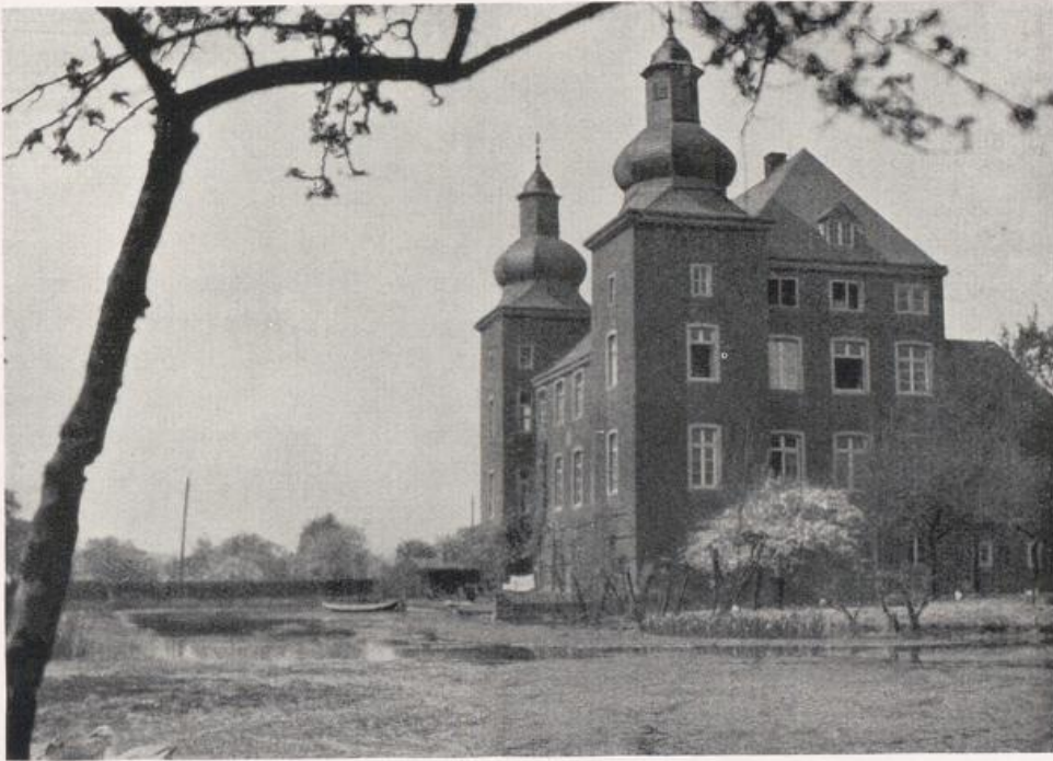
Haus Wohnung bei Götterswickerham, Zweite Hälfte 17. Jahrhunderts.