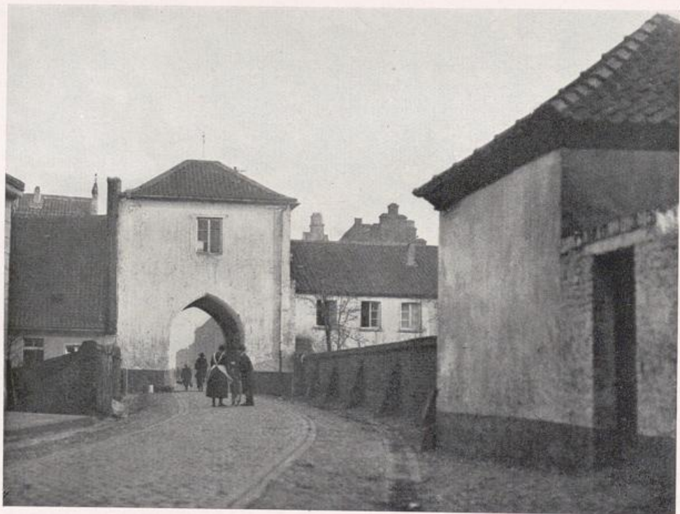
Orsoy. Die Kuhpforte.

Will indes der Hamborner an schönen Sommertagen nicht an das Orsoyer Rheinufer, so wandert er stromabwärts nach Götterswickerham. Warum hat man