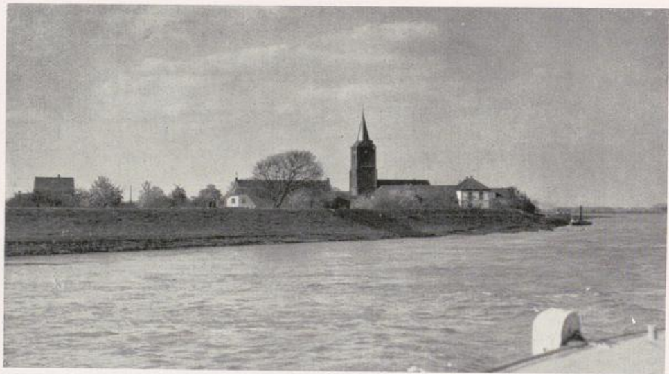
Mörmter am Niederrhein.

oder weniger abseits vom Ufer. Endlose Weite und Stille. Immer noch ist das Turmpaar des Xantener Domes das beherrschende Wahrzeichen der Ebene. Erst in Mörmter wagen sich wieder Kirche und Bauernhäuser hinter schützenden Deichen an das Ufer heran (Bild S. 432). Seltsames Bild in dieser Stille und Einsamkeit der weiten Stromlandschaft. Wie eine Erscheinung gleitet es an uns vorüber . . .