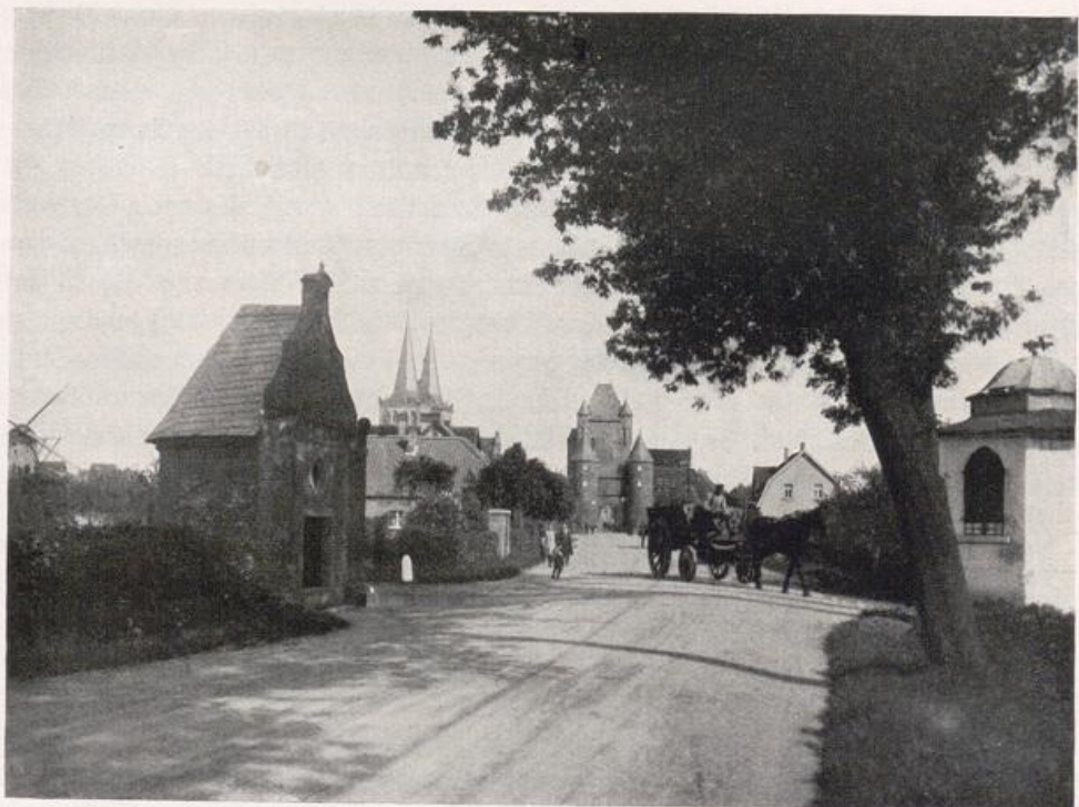
Xanten. Blick von der Klever Landstraße auf das Klever Tor (vgl. Bild S. 431). Rechts die Antoniuskapelle (17. Jahrh.).