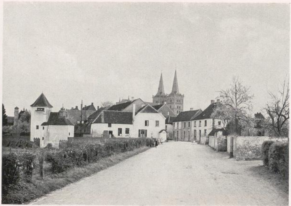
Xanten. Ansicht von Nordosten.