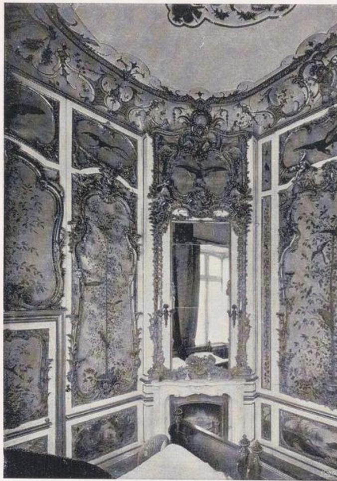
Schloß Falkenlust bei Brühl.