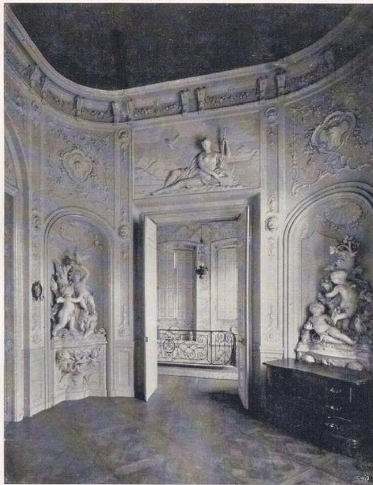
Schloß Falkenlust bei Brühl.

Speisezimmer, Schlafzimmer, Kabinett und Garderobe. Hier konnte sich Klemens August mit einem seiner Vettern oder