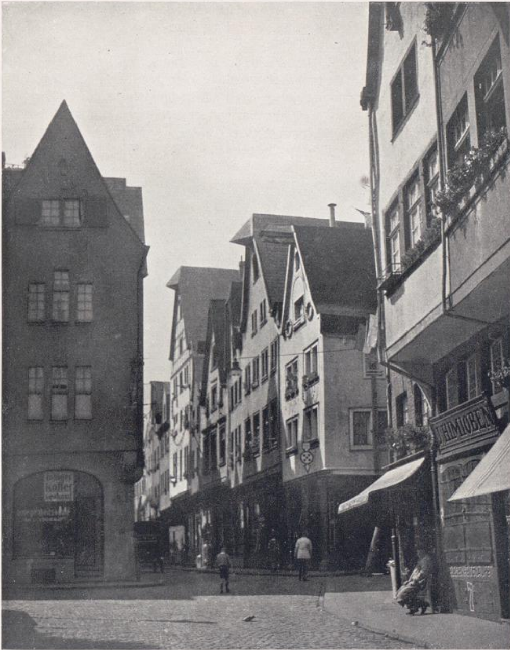
Köln. Alte Bürgerhäuser am Buttermarkt.