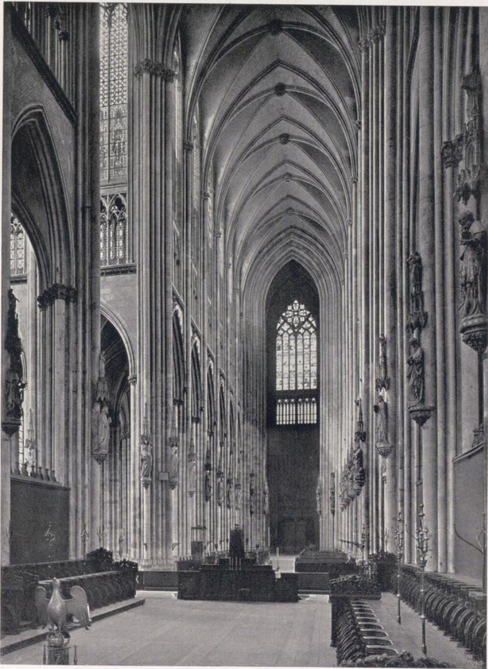
Der Dom zu Köln. Blick vom Chor auf den Eingang.