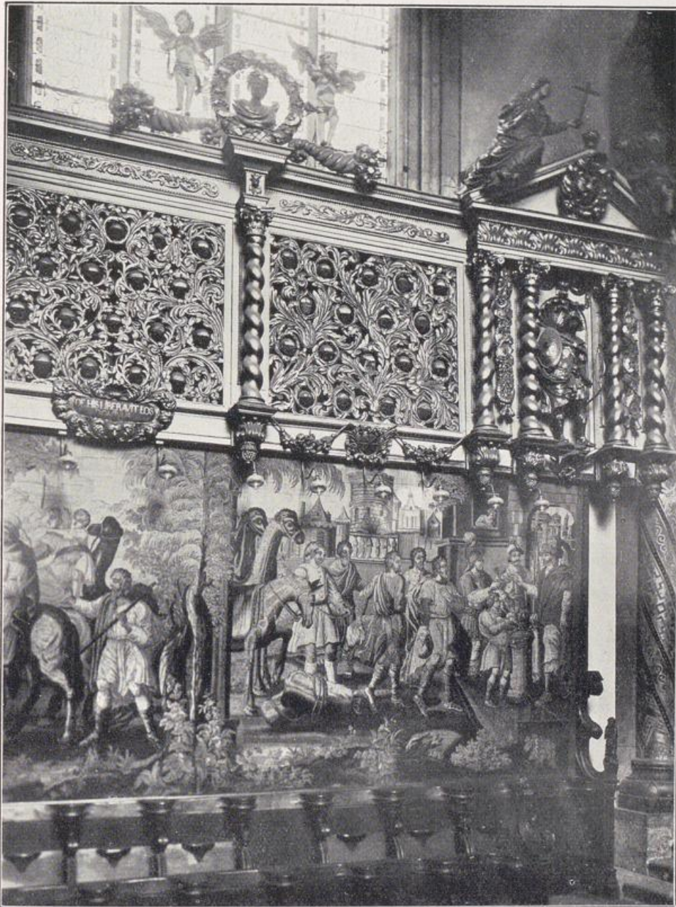
Köln — Gereonskirche. Wandteppiche (1765) und Reliquiare (1683) im Chor.