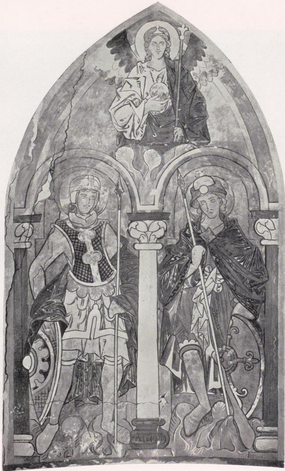
Köln — Gereonskirche. Wandgemälde in der Taufkapelle. — 1. Hälfte 13. Jahrhunderts.