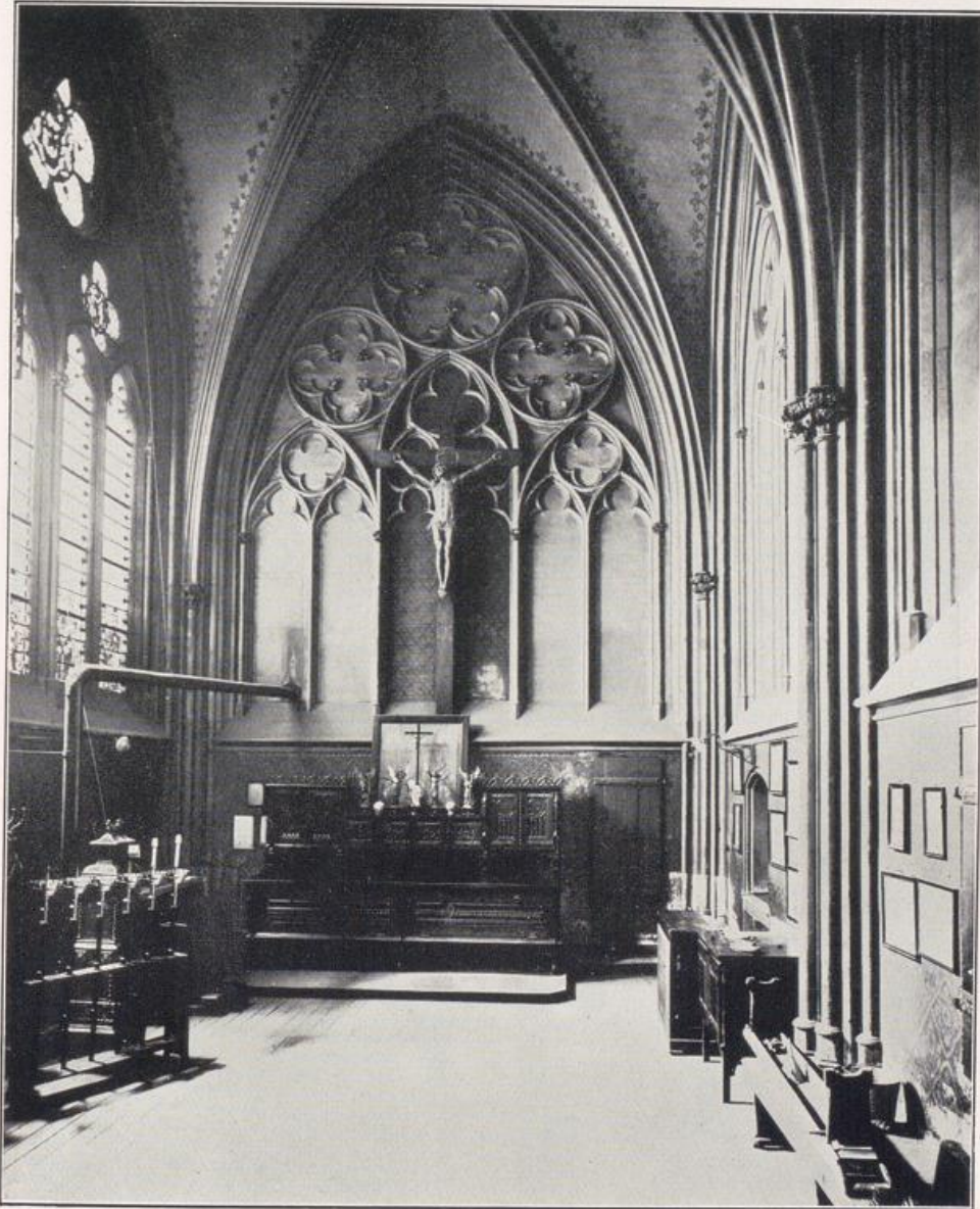
Köln — Gereonskirche. Sakristei Anfang des 14. Jahrhunderts.