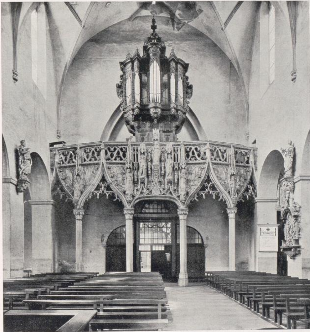
Köln — St. Pantaleon. Lettner um 1510.

bunt verglaste Chorfenster bricht sich gedämpft das Licht und überflutet den Altar (Bild S. 128). Diese farbenprächtigen Fenster sind das Schlußkapitel der Kölner Glasmalerei der Renaissance, die wir vorhin noch in St. Peter bewundern konnten. Und wenn man dann ermißt, wie wenig tief die Chorapsis ist, und welche reiche Tiefenwirkung diese genialen Barockdekorateure uns hier vorgezaubert haben, dann schweigt jedes Wort der Einzelkritik, und man läßt den Raum als Ganzes auf sich wirken.