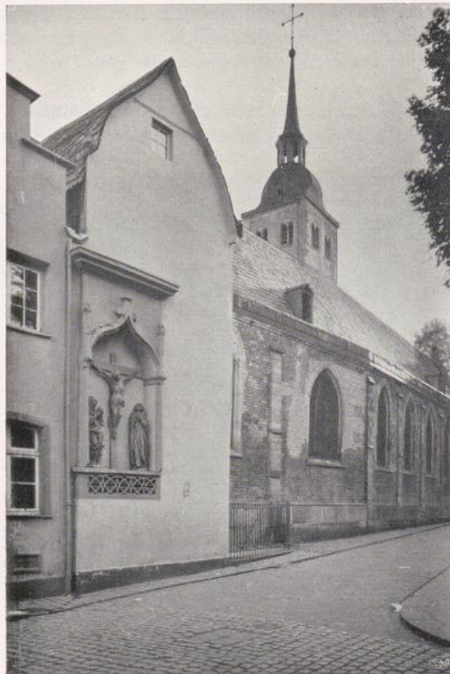
Köln — St. Johann Baptist.

Auf diese festlich feierliche Dekoration schaut links die Familienempore in das Chor herab (Bild S. 145).