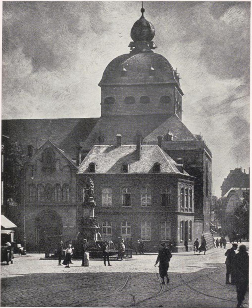
Köln — St. Georg.

Ansicht von Norden auf den Westbau. — Westbau begonnen um 1200, unvollendet geblieben. Turmhaube 17. Jahrhundert. — Vgl. Bild S. 151.