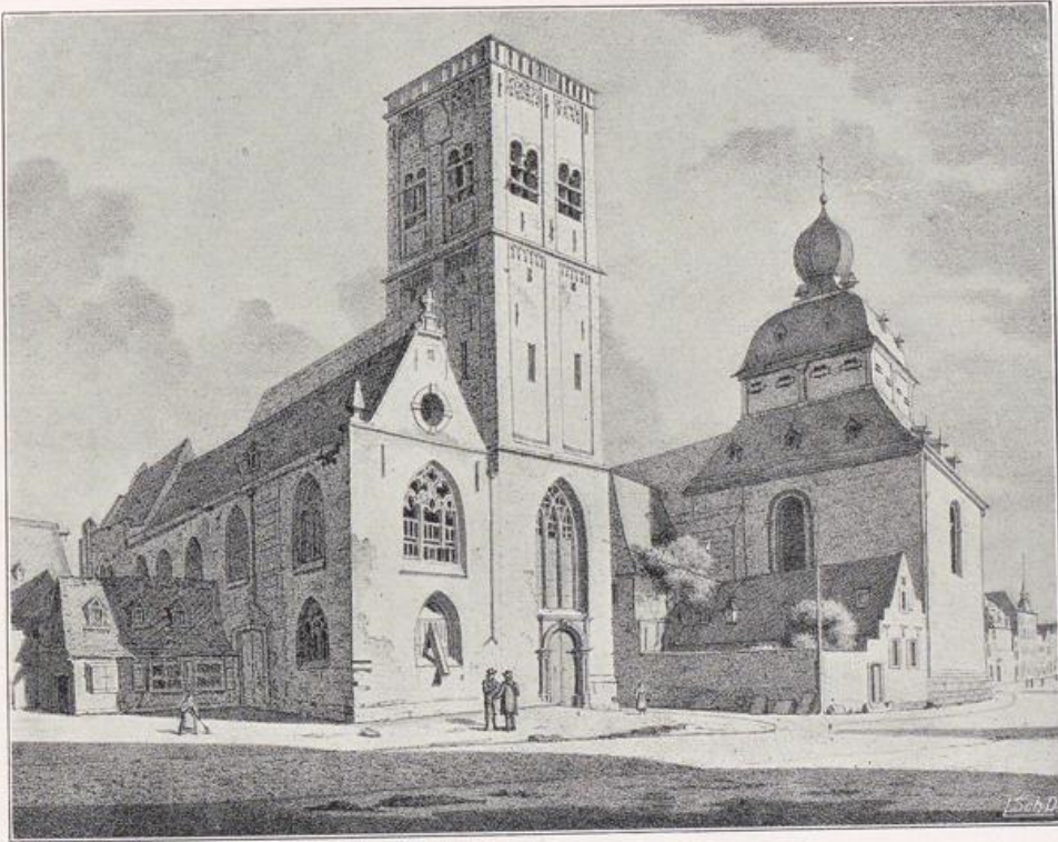
Köln — St. Jakob und St. Georg. Lithographie nach Weyer von Wunsch 1827.

bildete, der heilige Anno habe hier gegen die Kölner Bürger eine Zwingburg errichten wollen, jedoch diese hätten den Weiterbau mit Macht verhindert; so erkläre sich der Zustand der Unvollendung. Aber der heilige Anno ruhte schon über hundert Jahre, als man an seine Gründung den fast 18 Meter quadratischen Westbau anfügte, und zwar in voller Breite des Langhauses, d. h. des Mittel- und der beiden Seitenschiffe. Fünf Meter dick sind seine Mauern im Untergeschoß bis zu der hochgelegenen Fensterbank. Nach dem Langhaus zu sind im Mauerwerk des Westbaus Treppentürme angebracht, deren rechteckige Ummantelung nach außen vortritt. War es nun geplant, diese Treppentürme nach oben weiter zu entwickeln, ähnlich wie bei St. Aposteln, Groß-St.-Martin und St. Pantaleon, und mit reicherer Wandaufteilung der Zwerggalerien usw. entsprechend die Westbaubekrönung, den schon nach einem Geschoß verkümmerten Turmansatz? Der dickwandige Unterbau und die genannten Parallelen reden deutlich davon, daß der Westbau Torso geblieben ist und daß man hier etwas ganz Besonderes geplant hatte.