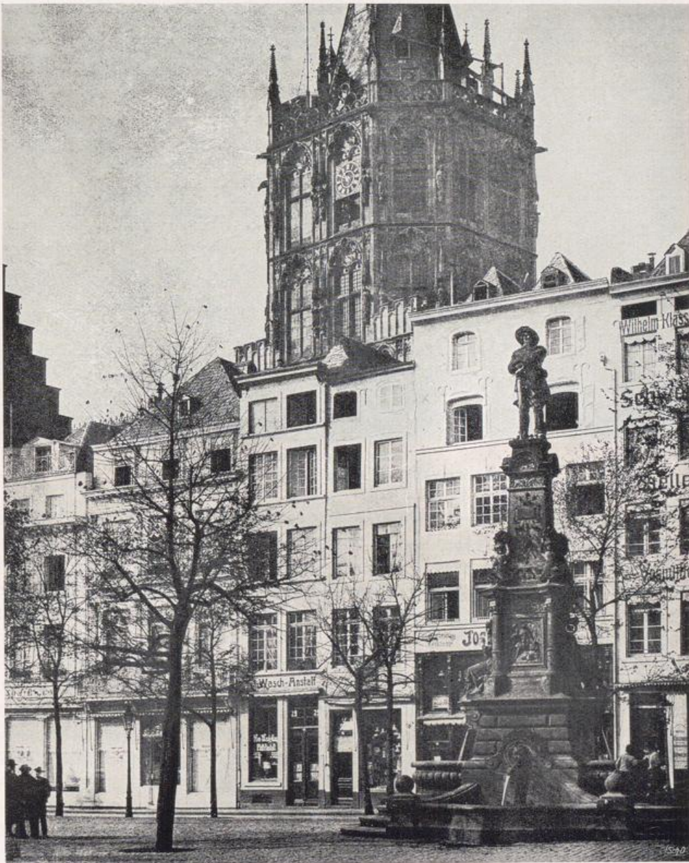
Köln — Rathausturm. Ansicht vom Alten Markt. — Vgl. Bilder S. 208.