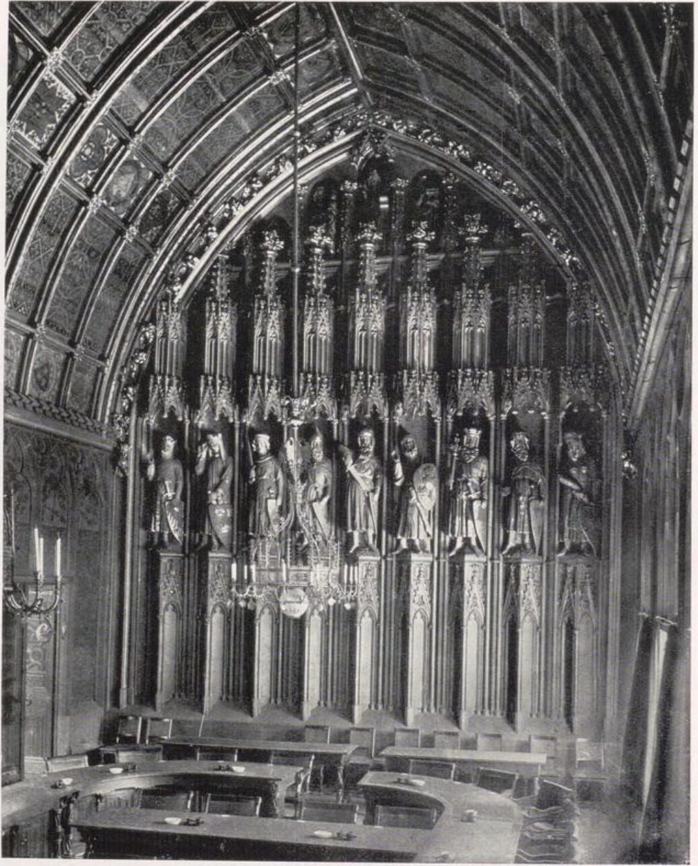
Köln — Rathaus. Hansa-Saal. 2. Hälfte des 14. Jahrhunderts.

Baldachine wachsen über ihnen auf, und Krabbenschmuck rahmt oben den Wandbogen ein. Eine eigene Stimmung erfüllt den Raum, wenn auch die alte Ausstattung nicht ganz mehr erhalten ist. Die Langseite den Fenstern gegenüber muß man sich einst reich ausgemalt vorstellen.