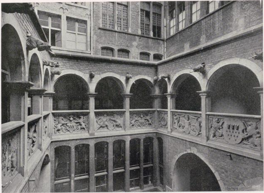
Köln — Rathaus.

Löwenhof. Erbaut 1540 von Meister Lorenz. — Vgl. Bild S. 207.