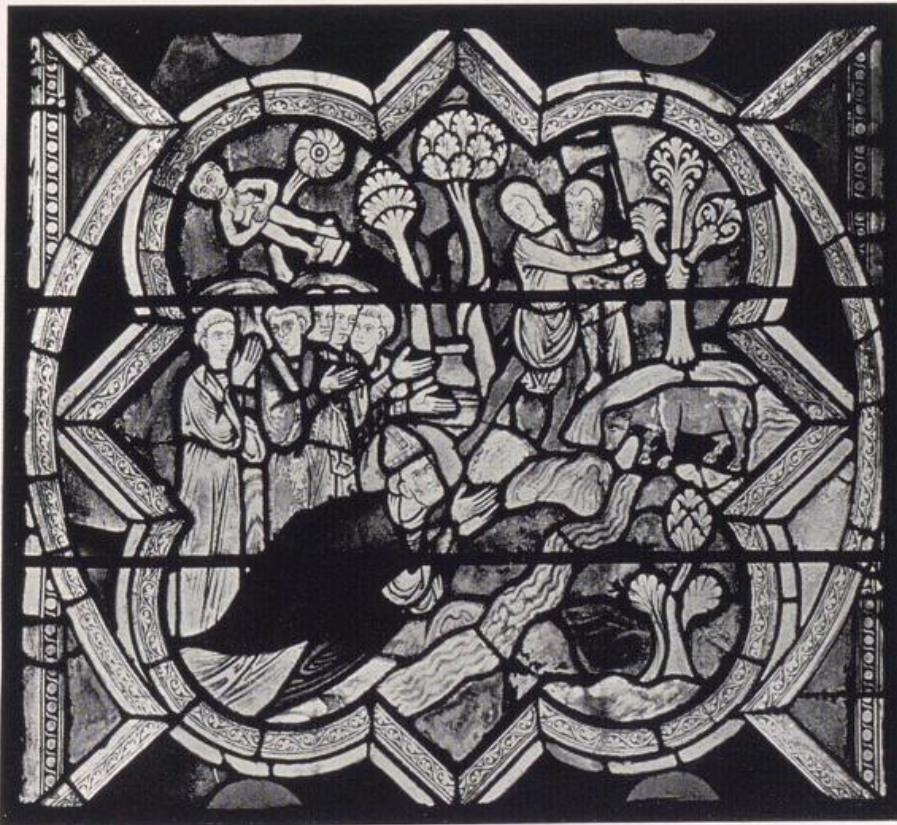
Köln — St. Kunibert.

St. Kunibert hatte Mitte des 13. Jahrhunderts nach einheitlichem Entwurf einen Glasfensterschmuck erhalten. Selbst in seinen Resten redet er uns noch an als künstlerisch höchste Glanzleistung spätromanischer Glasmalerei in ganz Deutschland! Ich kenne in der Tat wenige deutsche Kirchen, deren Chor, an sich schon schön in seinem Aufbau, seiner Gliederung nun noch verklärt wird durch das