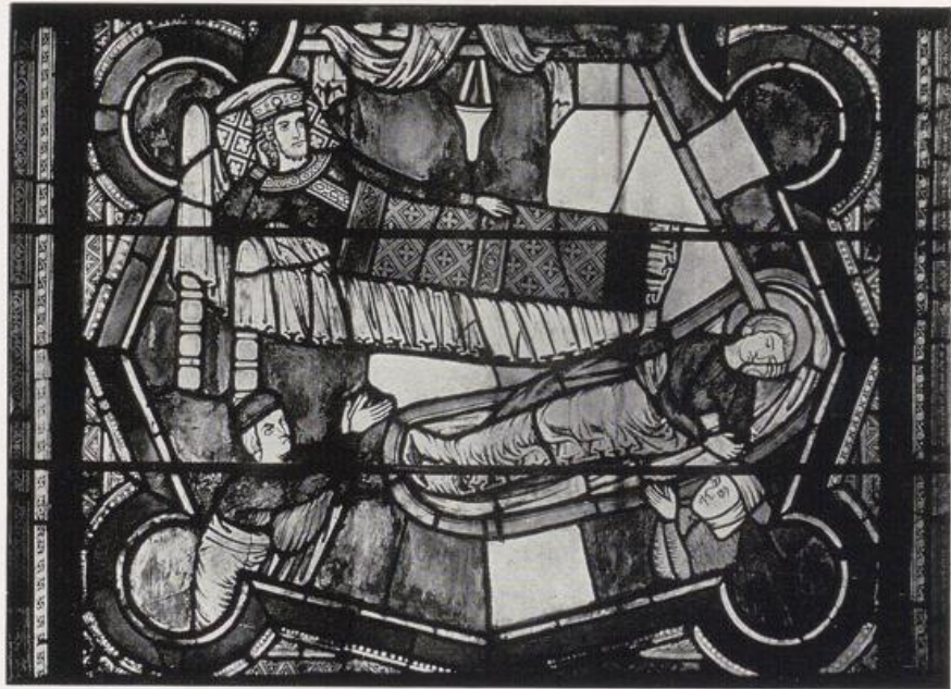
Köln — St. Kunibert.

Teil aus dem Kunibertsfenster im Chor. Mitte des 13. Jahrhunderts. — Vgl. Bild S. 222.