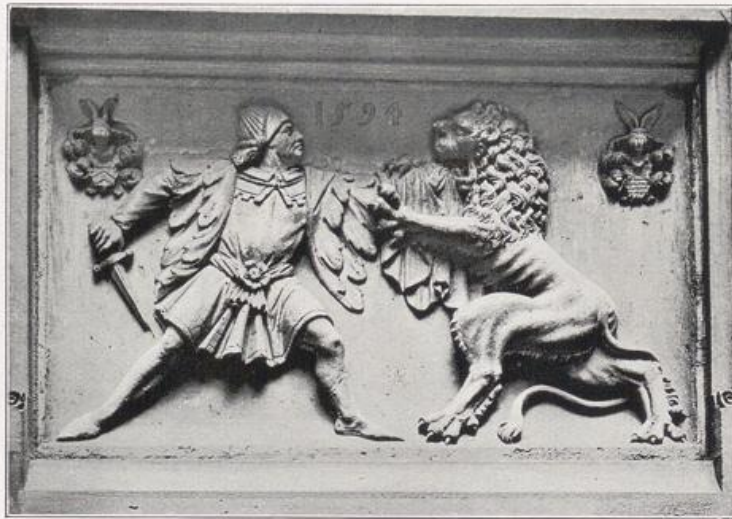
Der unerschrockene Bürgermeister von Köln. Relief aus dem Löwenhof des Rathauses. — Vgl. Bild S. 206.