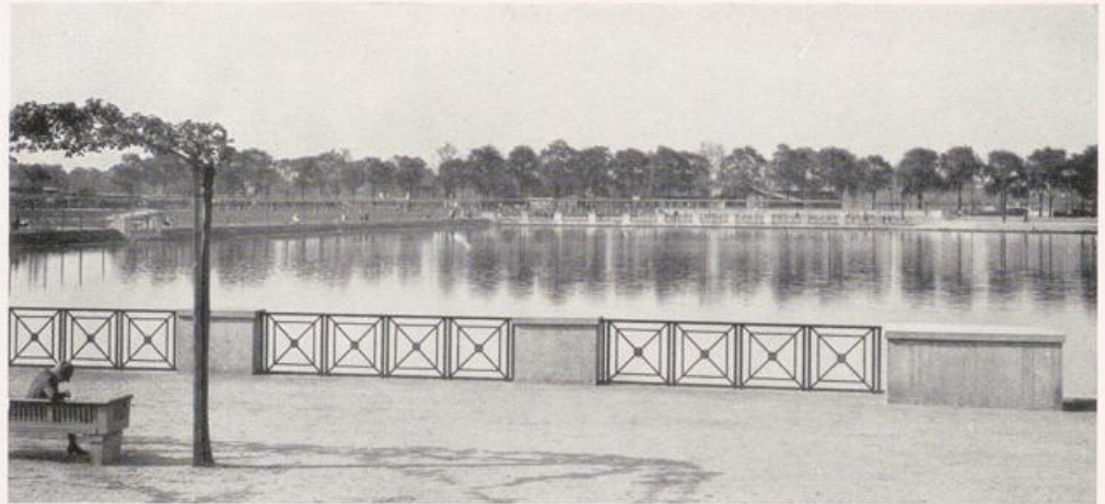
Köln — Wasserbecken an der Aachener Straße. Fortsetzung S. 247. — Vgl. Bild S. 245.