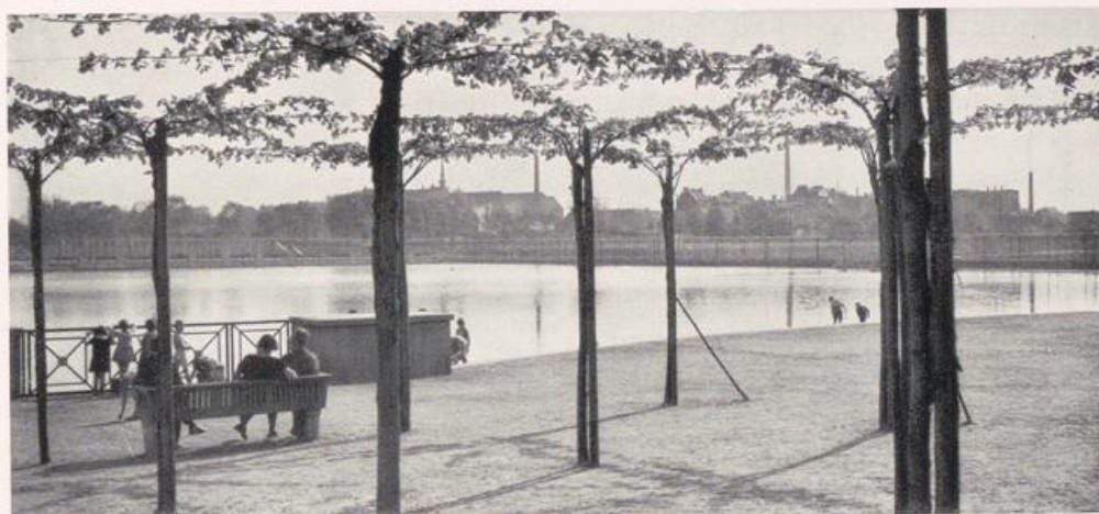
Köln — Wasserbecken an der Aachener Straße. Fortsetzung von S. 246.