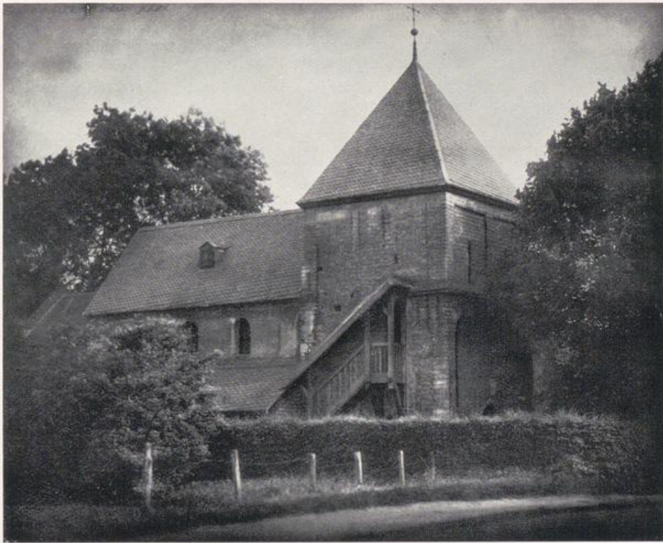
Köln — Kriel.

Das sogenannte „Krieler Dömchen“. — Turm 11. Jahrhundert, Langhaus 12. Jahrhundert.