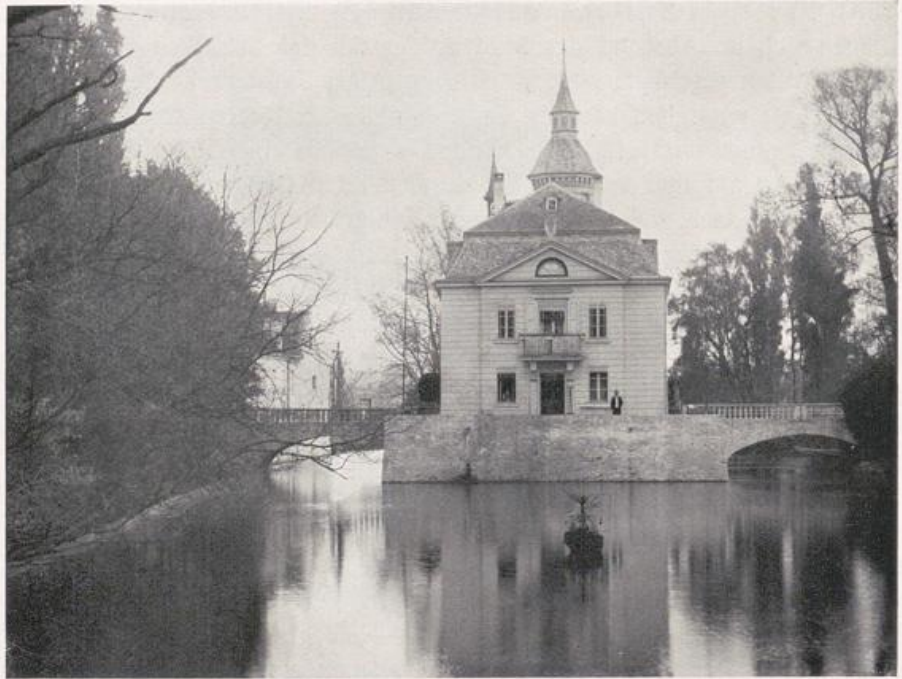
Köln — Sülz.

Landhaus „Weißhaus“. Erbaut zwischen 1776 und 1794.