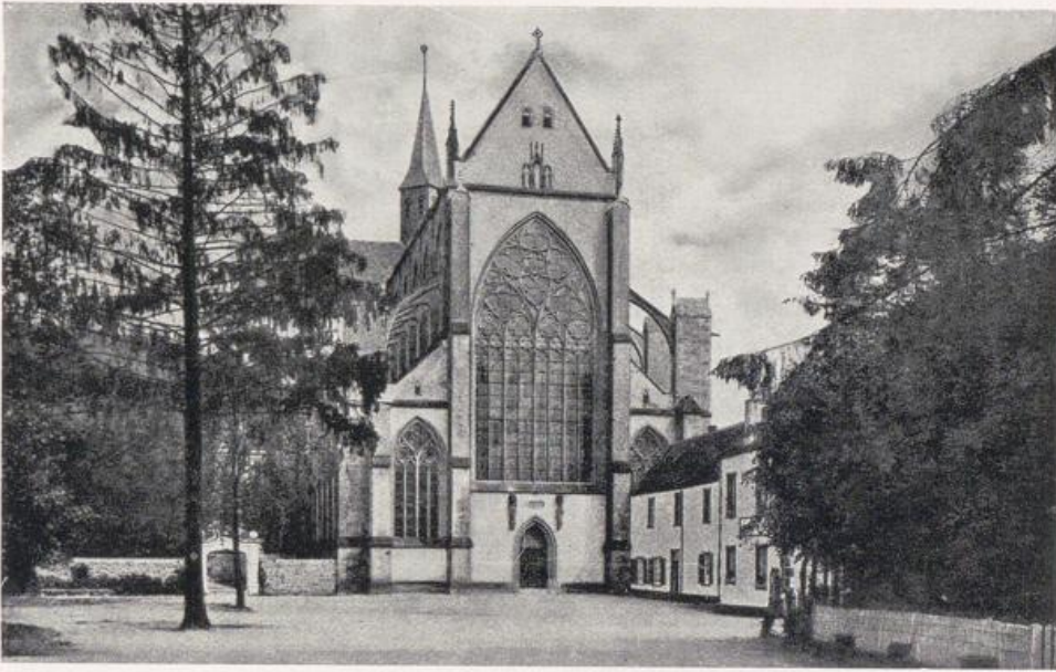
Dom zu Altenberg. Westfront. Vgl. Bild S. 268.

regeln der Cisterzienser, nur ein Dachreiter über der Vierung, wie bei der Ordenskirche zu Eberbach (I, S. 49).