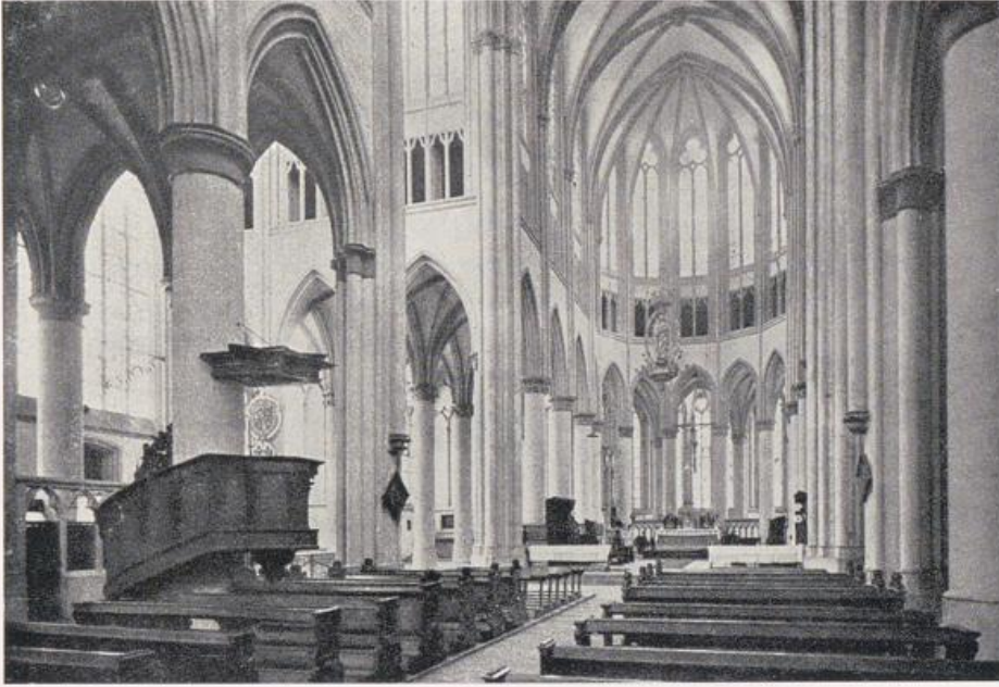
Dom zu Altenberg. Blick auf das Ostchor.