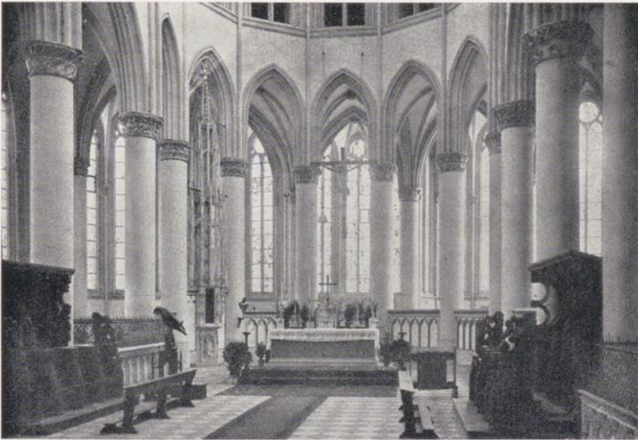
Dom zu Altenberg. Das Ostchor. Vgl. Bild S. 271 a.