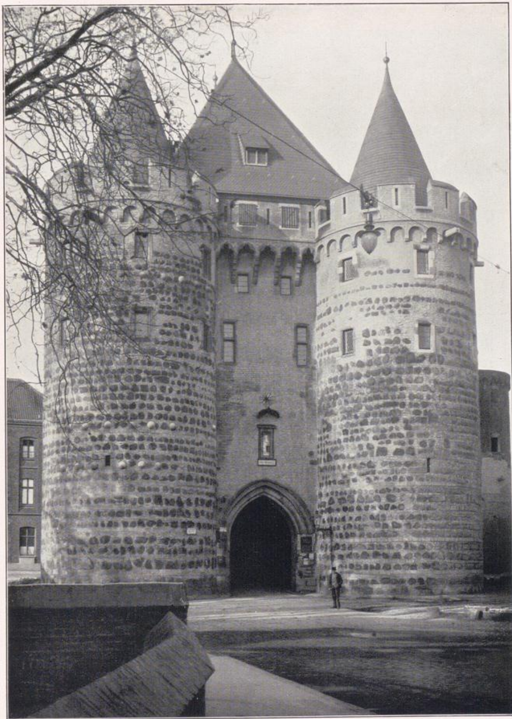
Das Obertor zu Neuß. Mitte 13. Jahrhunderts erbaut.