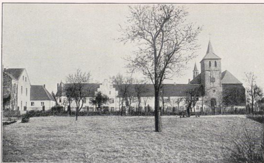
Hamborn. Ehemaliges Prémonstratenser Kloster.

Würde! Zweckmäßigkeit und Sinn für rhythmisches Gestalten charakterisieren auch die Anlage des Stadions (Bild S. 377 a). Peter Behrens' eindrucksvolles Lager- und Bürohaus der Guten-Hoffnungs-Hütte in dem benachbarten Oberhausen ist wegweisend für die baukünstlerische Gestaltung der Zukunft im Industrieland (Bild S. 376 u. 377 b).