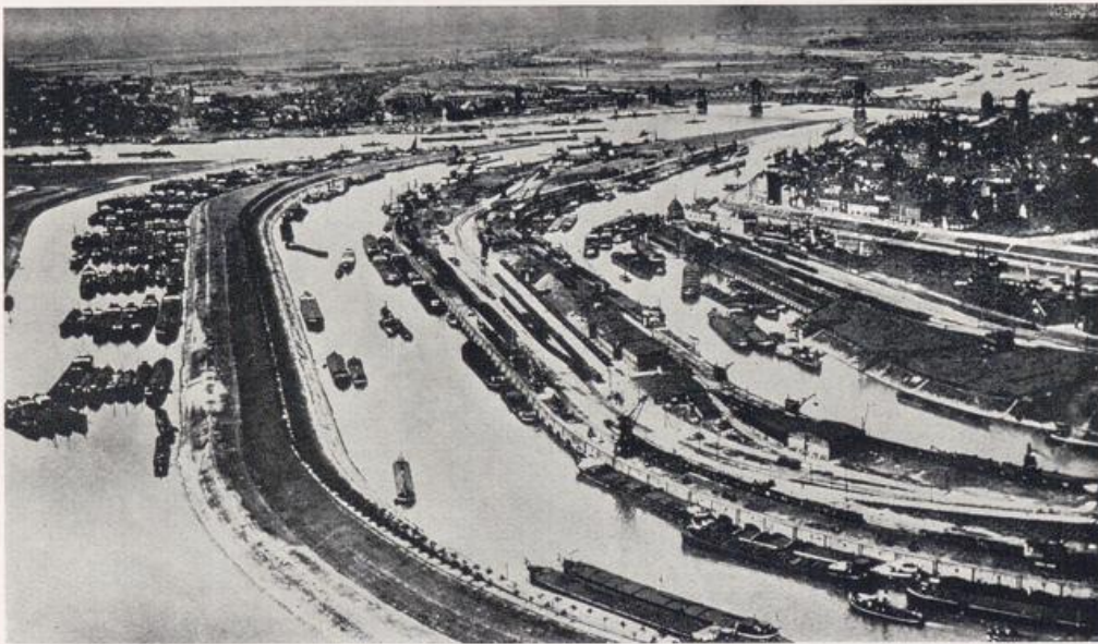
Der Duisburg-Ruhrorter Hafen.

Der Mittelpunkt Groß-Duisburgs, wo das Leben am stärksten pulsiert, ist nicht mehr die Altstadt-Duisburg mit dem Burgplatz, sondern die breite Königstraße vor den Toren der Altstadt, in die die beiden wichtigen Verkehrsstraßen von Düsseldorf und Mülheim einmünden. Monumentale Verwaltungs- und Geschäftsbauten werden ihr im Laufe der Jahre erst den richtigen Rahmen schaffen, und ein groß geplanter neuer Bahnhof mit geräumigem Bahnhofsvorplatz die würdige Auffahrt. Die Anlage des Königsplatzes mit Dülfers Theaterbau im Mittelpunkt, seitlich von Pregitzers Stadthaus und Großmanns Duisburger Hof flankiert, für den eigentlichen Platz vor dem Theater noch monumentale Einfassungen vorgesehen, das war städtebaulich ein glücklicher Einfall. Die Stadt mußte ihrer Bedeutung entsprechend ein Forum erhalten. Die Fortsetzung der Königstraße, ein notwendig gewordener Durchbruch, führt durch die Altstadt zum Schwanentor, dann zu den Hafenanlagen. Zweckmäßigkeit, städtebauliches Sicheinfügen und Unterordnen, schlicht bei aller Würde großstädtischer Repräsentation, das sind das Leitmotiv der monumentalen Bauten des Stadthauses und des Duisburger Hofes am Königsplatz.