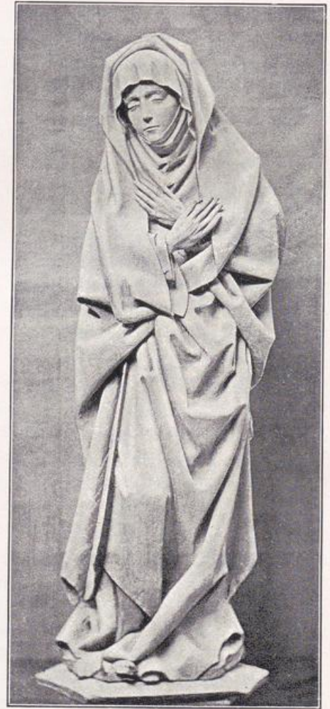
Kalkar — St. Nikolai.

Maria und Johannes über dem südlichen Eingang im Innern. Früher seitlich vom Kruzifixus über dem abgebrochenen Lettner (um 1450).