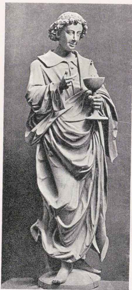
St. Johannes vom Johannesaltar (um 1540).