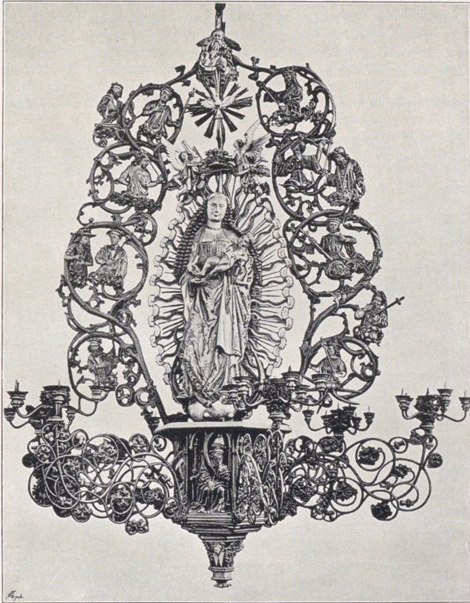
Kalkar — St. Nikolai.