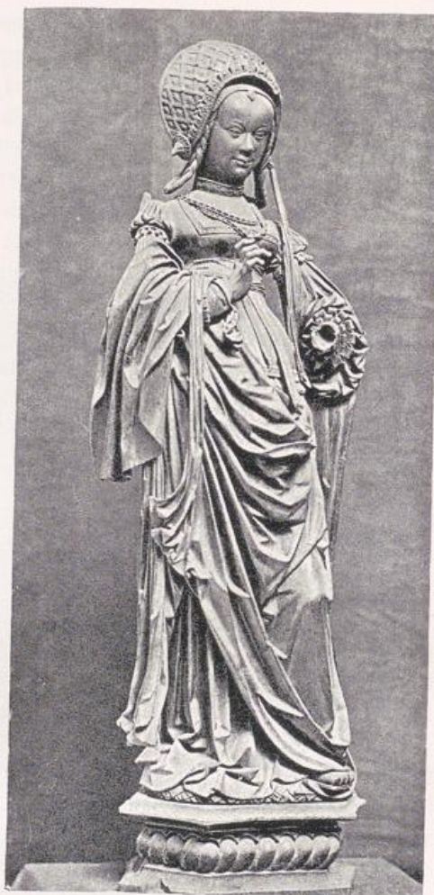
Maria Magdalena vom Crispinusaltar (um 1540).