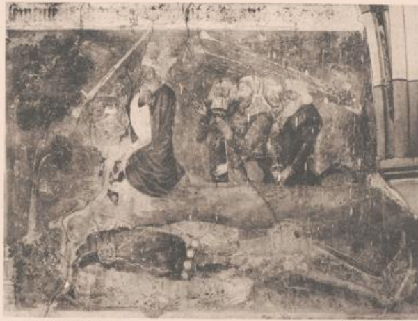
V. DAVID TRÄGT TRIUMPHIEREND DAS HAUPT DES ERSCHLAGENEN GOLIATH. (BIBEL, VIERTES GEWÖLBBUCH, UNTERE ANSCHLUNG RECHTS.)