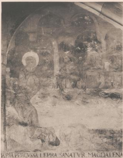
MARIA MAGDALENA SALBT UND TROCKNET DIE FÜSSE CHRISTI. (DURCHLEGEEL, DRITTES GEWÖLBEBOGEN, RECHTE HÄLFTE DER OBEREN ABTHEILUNG.)