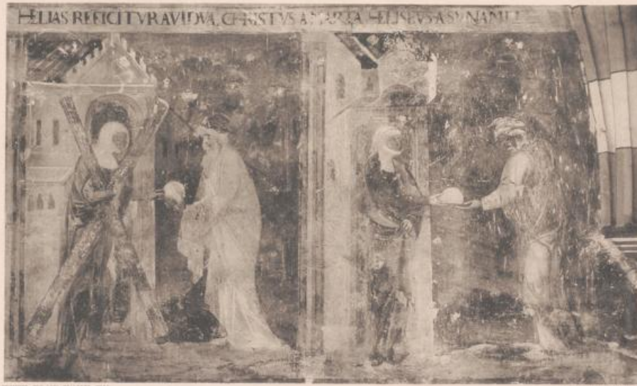
DIE WITWE VON SAREPTA REICHT DEM ELIAS DAS BROT.

(NORDPLATEL, ZWEIFTE BUCHSTÄBENZEICHEN, RECHTE HÄLFTE DER UNTEREN ABTHEILUNG.)