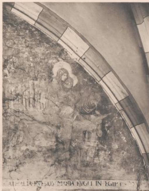
DIE FLUCHT NACH ÄGYPTEN. (WESTFLÜGEL, STÄRKE GEWÖLBEBOGEN, RECHTE HÄLFTE DER OBEREN ABTHEILUNG.)