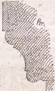
Deckglieder der Säulen- kapitel in der Krypta.

mit hohem Chor, unter dem letzteren eine ausgedehnte Krypta, — bewahrt. Ohne Zweifel gehören die hievon erhaltenen Theile jenem Neubau des Domes an, welcher im Jahre 1043 begonnen wurde und dessen festes Quaderwerk die Bewunderung der Zeitgenossen ausmachte 1) . Zu diesen Theilen sind zunächst die Arkaden des Mittelschiffes zu zählen, deren Pfeiler in ihrer ursprünglichen Anlage, wie dies deutlich erkennbar ist, eine einfach viereckige Form hatten, mit allereinfachsten schweren Kämpfer- und Fussgesimsen, welche nur aus einer grossen