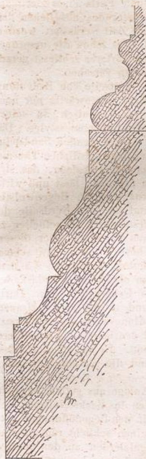
Fußgliederung der Pfeiler (Uebergangsepoche.)

entschieden den Charakter der letzten Entwicklungszeit des Uebergangsstyles, mit durchaus vorherrschendem Spitzbogen, trägt und, den später bei andern Kirchen anzuführenden Daten analog, jener Epoche des zweiten Viertels des dreizehnten Jahrhunderts angehört. Doch hat dieser Umbau zugleich sehr räthselhafte Eigenthümlichkeiten, zu deren vollkommener Erläuterung spezielle lokalgeschichtliche Forschungen wünschenswerth sein dürften; auch ist er, wenn gleich seinen Haupttheilen nach der eben genannten Epoche durchaus angehörig, doch in derselben, wie es scheint, nicht ganz zu Ende gebracht worden; wenigstens sind die Gewölbe zum Theil jünger, sowie offenbar auch wiederum einige spätere Veränderungen dabei statt gehabt haben.