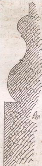
Basis der alten Halbsäulen (Ostseite d. Kreuzes.)