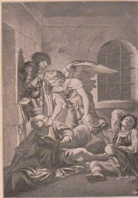
Domenichino. Befreiung Petri.

käme. Durch die Regungslosigkeit der Hauptperson gewinnt nun aber Raffael ausserdem den Ausgangspunkt für eine wundervolle Steigerung, wie das Geschehene auf die gläubige Menge wirkt. Die Chorknaben, die die nächsten sind, flüstern unter einander, die Körper kommen in Bewegung, der vorderste neigt sich unwillkürlich in Anbetung. Auf der Treppe aber entsteht ein Drücken und Drängen, bis die Wallung ihren Höhepunkt erreicht in der Frau ganz vorn, die aufgesprungen ist und mit Blick und Gebärde, ja mit der ganzen Gestalt emporverlangend als eine Verkörperung des Glaubens überhaupt gedeutet werden könnte. So wenigstens haben ältere Künstler die Fides sich vorgestellt und es giebt ein Relief des Civitali, das in dem zurückgeworfenen Kopf mit dem halbverlorenen Profil die grösste Ähnlichkeit besitzt. (Florenz, Museo Nazionale.) Den Schluss der Kette bilden hockende Frauen mit Kindern, unten an der Treppenwange gelagert, die stumpfe Menge, die noch nichts von dem Vorgang ahnt.