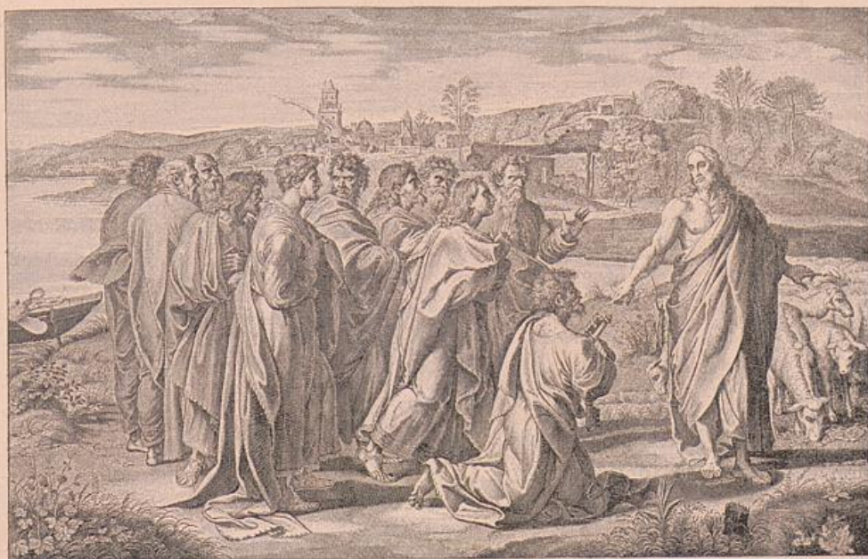
Raffael. »Weide meine Lämmer!« Nach dem Stich von N. Dorigny.

musste eine wirkliche Herde ins Bild aufgenommen werden und mit energischer Doppelbewegung der Arme giebt Christus dem Befehl Ausdruck. Was bei Perugino nur gefühlvolle Pose ist, ist hier wirkliche Aktion. Mit historischem Ernst ist der Moment gefasst. Und so der kniende Petrus, dringlich in dem Emporblicken, voll momentanen Lebens. Und die übrigen? Perugino giebt eine Reihe von schönen Stehmotiven und Kopfneigungen. Wie sollte er anders; die Jünger haben ja bei der Sache nichts zu thun; fatal, dass es so viele sind, die Scene wird ein wenig einförmig. Raffael bringt etwas Neues und Unerwartetes. In gedrängter Masse stehen sie zusammen, kaum dass Petrus sich wesentlich loslöst; aber in diesem Haufen — Welch eine Fülle verschiedenartigen Ausdrucks! Die Nächsten angezogen von der Lichtgestalt Christi, mit den Augen ihn verzehrend, bereit, dem Kniefall Petri zu folgen, dann ein Stocken, ein Bedenklichwerden, ein fragendes Sichumsehen und endlich das erklärte misstrauische Zurückhalten. Es ist der auferstandene Christus, der den Jüngern erschienen ist, er hat sie angesprochen, aber ist er's wirklich oder ist es ein Trug? Wie das Gefühl der Gewissheit die Menge nur allmählich durchdringt, erst die nächsten Kreise angezogen sind, die ferneren sich noch verschliessen, das ist die Fassung, die Raffael dem Thema gegeben hat,