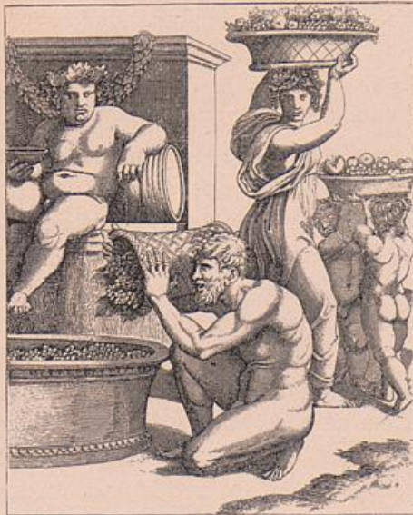
Weinlese. Nach dem Stich des Marc Anton.

1) Dieses berühmte Bild ist nicht nur in der Ausführung nicht von Raffael, sondern es muss auch die Redaktion überhaupt in fremden Händen gelegen haben. Das Hauptmotiv des über die Schulter umblickenden Christus ist ergreifend und jedenfalls echt wie die Entwicklung des Zuges im grossen, allein daneben finden sich wüste Unklarheiten und Entlehnungen aus anderen Werken Raffaels, so dass eine persönliche Beteiligung des Meisters an der Komposition ausgeschlossen erscheint.