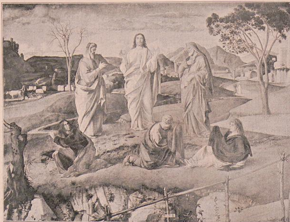
Giovanni Bellini. Transfiguration.

Aber nun wollte er damit nicht schliessen, er verlangte nach einem Kontrast, nach einem starken Widerspiel und er fand es in der Geschichte mit dem besessenen Knaben. Es ist die konsequente Entwicklung der Kompositionsprinzipien, die er im Heliodorzimmer angewendet hatte. Oben das Stille, das Feierliche, die himmlische Beseeligung, unten das laute Gedränge, der irdische Jammer.