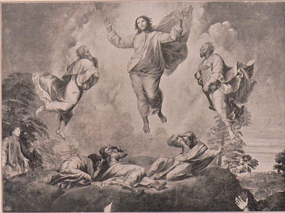
Raffael. Transfiguration (Ausschnitt).

aber die grosse Kontrastökonomie muss sein originaler Gedanke gewesen sein.