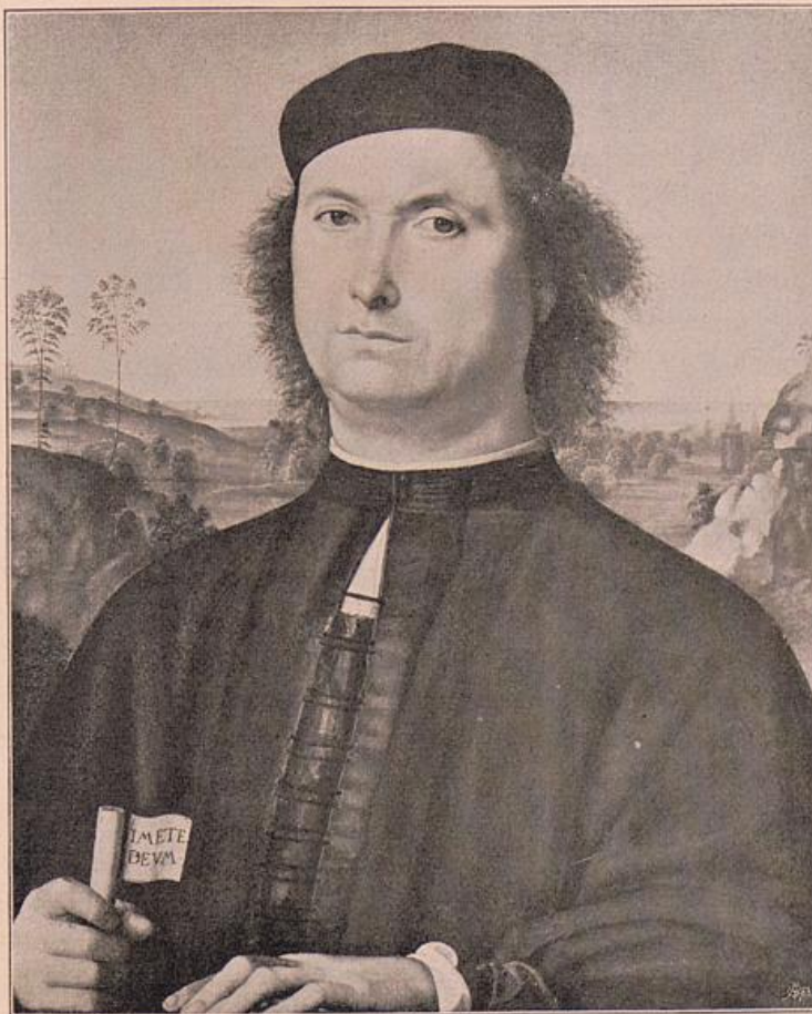
Perugino. Francesco dell' Opere.

selbst in seinem Büchlein vom »Cortigiano« aufgestellt hat. Die modestia ist der Grundzug seines Charakters. Ohne vornehme Pose kennzeichnet sich der Adelige durch das anspruchslose, zurückhaltende, stille Wesen. Was das Bild reich macht, ist die Drehung der Figur — nach dem Schema der Mona Lisa — und das in prächtig grossen Motiven disponierte Kostüm. Und wie grandios die Silhouette sich entwickelt! Nimmt man dann etwa ein älteres Bild, wie das männliche Porträt Peruginos aus den Uffizien, zur Vergleichung heran, so wird man auch entdecken, dass die Figur ein ganz neues Verhältnis zum Raum bekommen hat und die Wirkung der räumlichen Weite, der grossen stillen Hintergrundsflächen im Sinne der mächtigen Erscheinung empfinden lernen. Die Hände beginnen hier schon zu verschwinden.