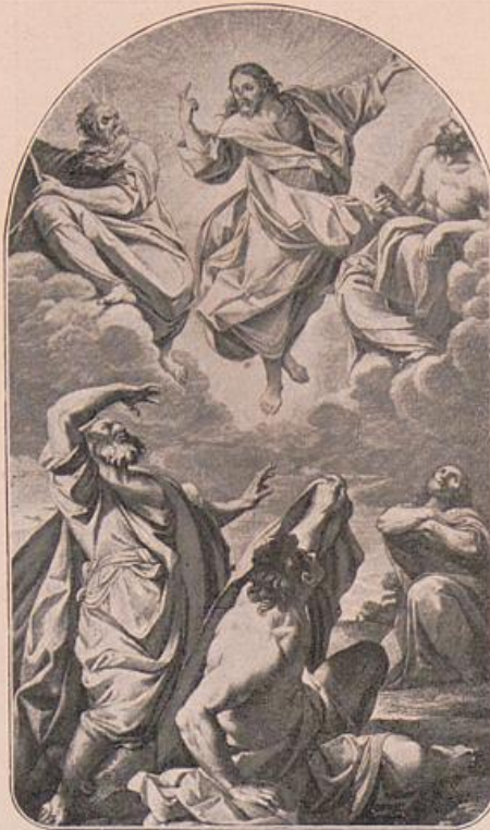
L. Carracci. Transfiguration.

Man begreift den Grimm Sebastianos, dass ihm durch solche Leute in Rom der Weg versperrt sein sollte. Sebastiano ist zeitlebens ein gehässiger Nebenbuhler Raffaels gewesen, allein sein Talent gab ihm das Recht, auf die ersten Aufgaben Anspruch zu machen. Einige venezianische Befangenheiten ist er nie ganz los geworden. Mitten im monumentalen Rom hält er noch fest an dem Schema des Halbfigurenbildes und zu einer vollkommenen Herrschaft über den Körper mag er nicht gekommen sein. Es fehlt ihm auch das höhere Raumgefühl, er verwirrt sich leicht und wirkt dann eng und unklar. Allein er besitzt eine wahrhaft grosse Auffassung. Als Bildnismaler steht er in der allerersten Linie und in den historischen Bildern erreicht er hie und da einen so gewaltigen Aus-