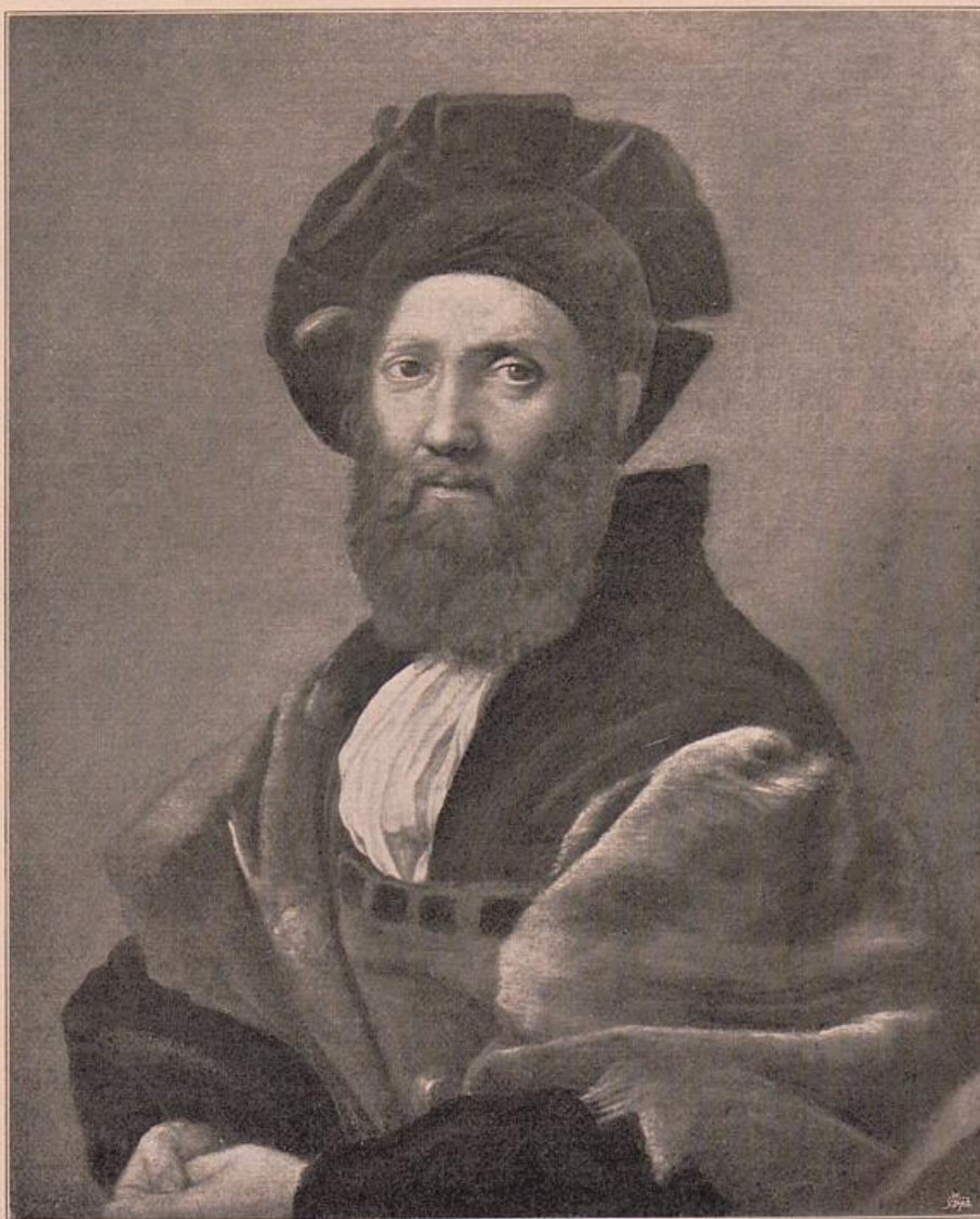
Raffael. Der Graf Castiglione.