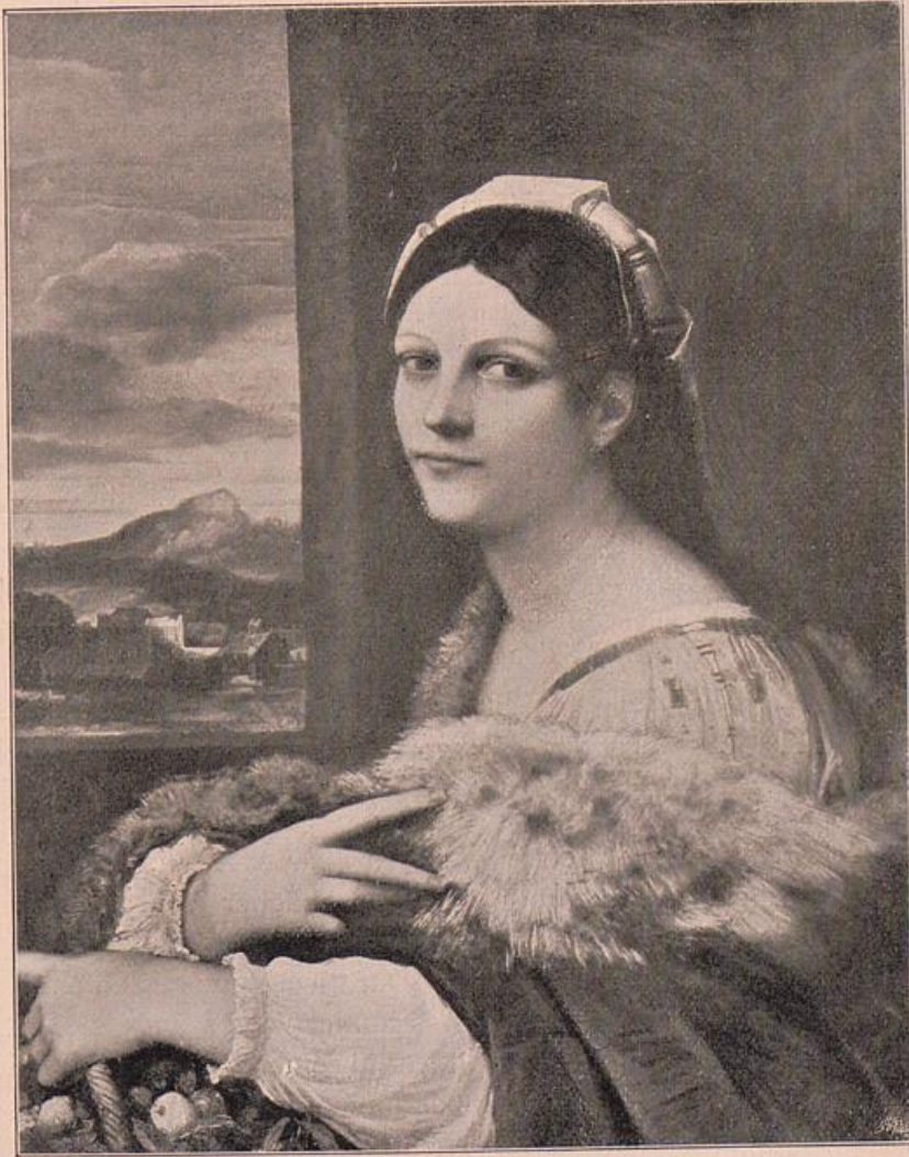
Sebastiano del Piombo. Weibliches Bildnis (Dorothea).