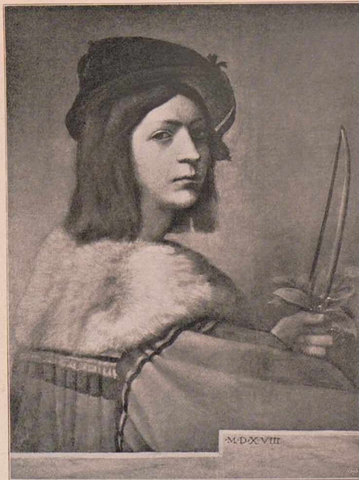
Sebastiano del Piombo. Der Violinspieler.

Weibliche Bildnisse hat Raffael wenige gemalt und vor allem hat er die Neugier der Nachwelt unbefriedigt gelassen, wie seine Fornarina ausgesehen habe. Früher hat man auch hier bei Sebastiano Anleihen gemacht und beliebige schöne Frauen auf Raffael getauft und als seine Geliebte in Anspruch genommen, wie es der jungen Venezianerin in der Tribuna und der Dorothea aus Blenheim (Berlin) gegangen ist; neuerdings sucht man sich wenigstens insofern schadlos zu halten, dass man die Donna Velata (Pitti), die als gesicherter Raffael gilt, nicht nur für das Modell zur Sixtinischen Madonna, sondern auch für das idealisierte Porträt eben der gesuchten Fornarina erklärt. Die