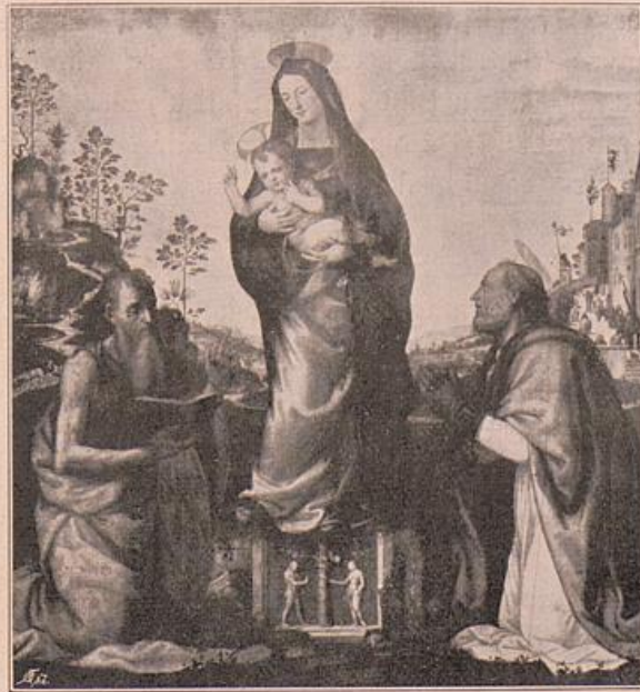
Albertinelli. Madonna mit zwei knienden Heiligen. 1506