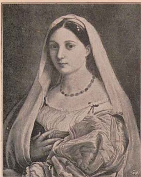
Raffael. Donna Velata.

erstere Beziehung ist offenbar, die zweite hat wenigstens eine alte Tradition für sich.