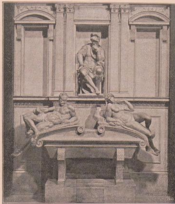
Michelangelo. Grab des Lorenzo Medici mit den Figuren von Morgen und Abend.

Schaustück an der medicäischen Familienkirche in Florenz aufführen sollte, enthielt die Möglichkeit, Figuren und Bauformen mit bestimmter Wirkungsrechnung im grossen zusammenzukomponieren. Das Projekt hat sich zerschlagen. Wenn aber hier die Architektur doch nur Rahmen hätte sein können, so war es künstlerisch noch dankbarer, in der neuen Aufgabe der Grabkapelle einen Raum zu bekommen, der nicht nur eine freiere Ausdehnung für die Plastik zuliess, sondern der auch das Licht völlig in die Hände des Künstlers gab. Michelangelo hat denn auch