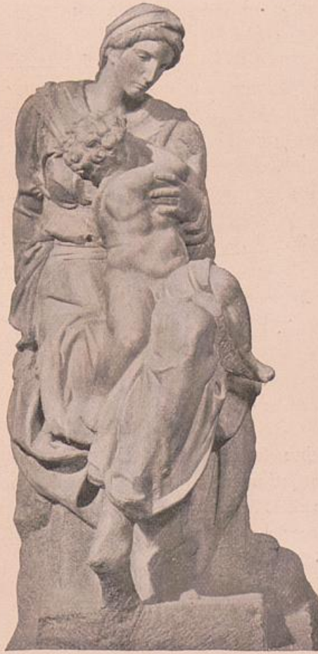
Michelangelo. Madonna Medici.

Die Behandlung der Sitzfiguren als solche ist interessant im Hinblick auf die vielen früheren Lösungen der Aufgabe, die Michelangelo schon gegeben hat. Die eine nähert sich dem Hieronymus von der sixtinischen Decke, die andere dem Moses. Bei beiden aber sind charakteristische Veränderungen im Sinne der Bereicherung vorgenommen worden. Man beachte bei Giuliano (mit dem Feldherrnstab) die Differenzierung der Kniee und die ungleiche Stellung der Schultern. An diesen Mustern wurden künftighin alle Sitzfiguren auf ihren plastischen Inhalt hin gemessen und bald ist kein Ende mehr abzusehen in den angelegentlichen Bemühungen, mit herumgeworfenen Schultern, hochgesetztem Fuss und verdrehtem Kopf interessant zu erscheinen, wobei der innere Gehalt notwendig verloren gehen musste.