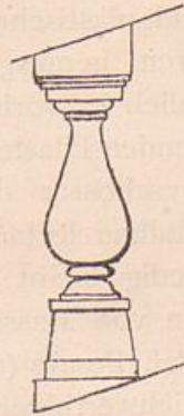
Abb. 2. Balustrade nach Giacomo della Porta.

b. Von einschneidendster Bedeutung wird das Princip für die Komposition im Grossen, für Aufriss und Grundriss.