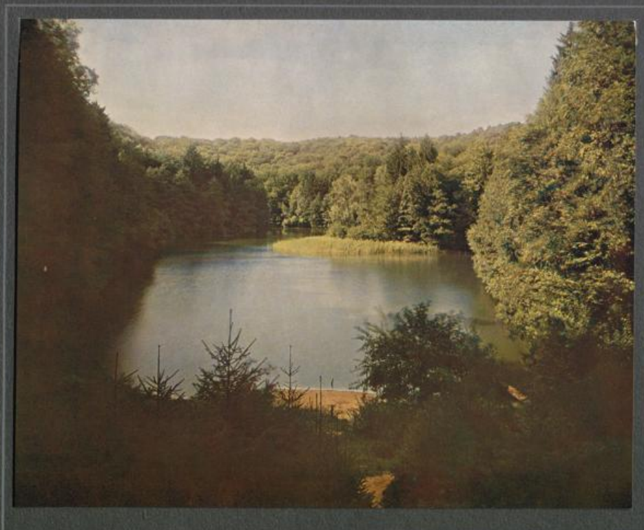
Der Bausee bei Freinswalde a. O.