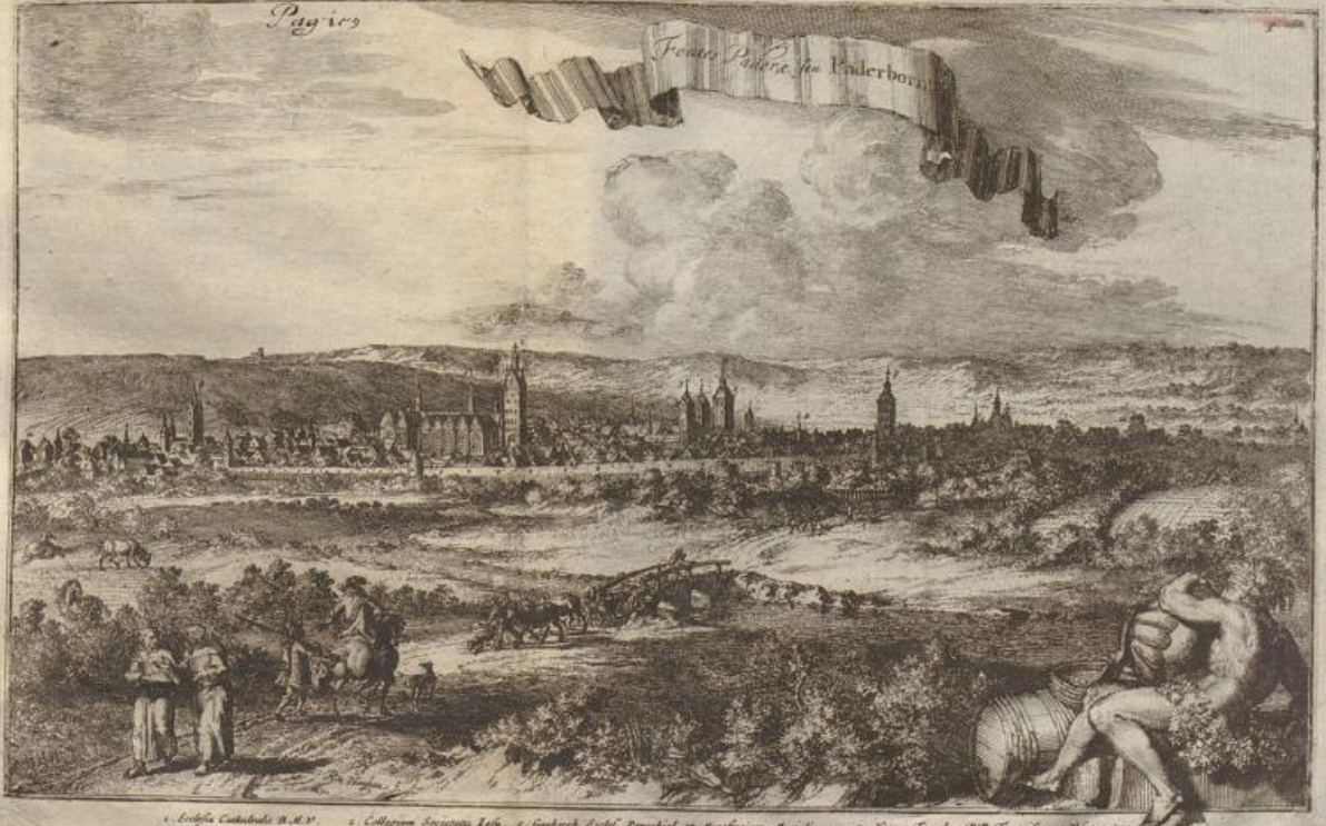
1. Ecclesia Cathedralis B.M.V. 2. Collegium Societatis I.J.S. 3. Godehardi Eccles. Parochial. et. Augustinian. Monachorum. 4. Collegium S. Petri et. Pauli, dicta in Defensor. 5. Mariæ Eccles. Parochial. S. Pancratii. 6. Novum Templum P.P. Franciscan. Observant. 7. Templum Capucinorum. 8. Rinkes præ. 9. Porta occidentalis. 10. Strata ibid.