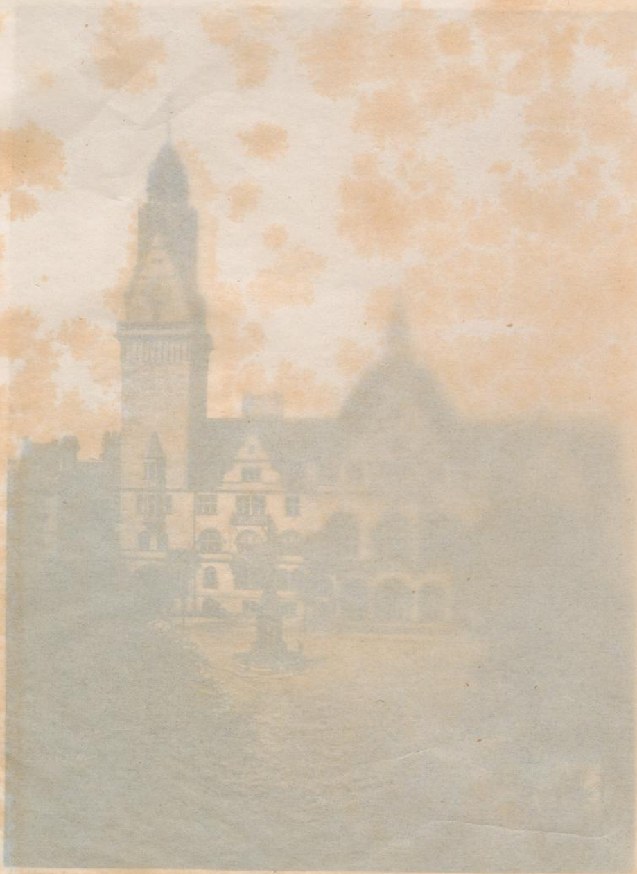
Rathaus vom Burgplatz aus.