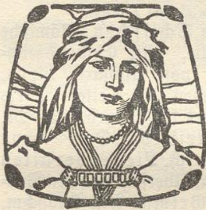
Einbandzeichnung zu: Waltharilied. Der arme Heinrich. Lieder der alten Edda.