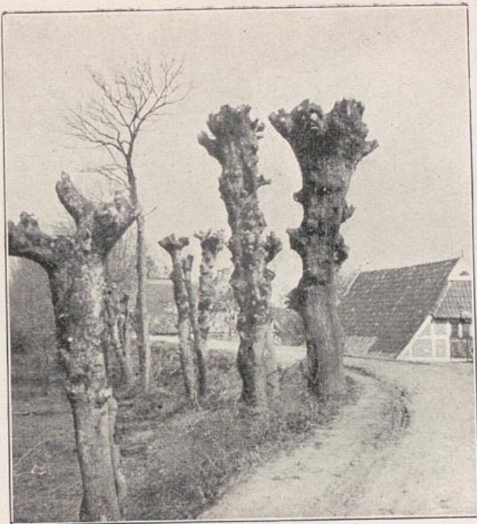
9. Bäume, der Schattenverringering wegen gestutzt (Dierlande b. Hamburg).