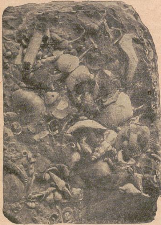
Fig. 124. Sternberger Kuchen. (Oligocäne Muschelanhäufung.)

Dem Unteroligocän gehört die tiefste Braunkohlenformation an, welche bei Egel, Helmstadt und Aschersleben abgebaut wird und ebenso dürfen wir hierher die bernsteinführenden blauen glaukonitführenden Sande des Samlandes bei Königsberg rechnen. Ueber ihnen lagert eine marine Stufe mit Ostrea ventilabrum (Lattorf und Egel), und die etwas jüngeren, aber gleichfalls noch unteroligocänen Braunkohlenformationen von Halle, Leipzig und Kaufungen.