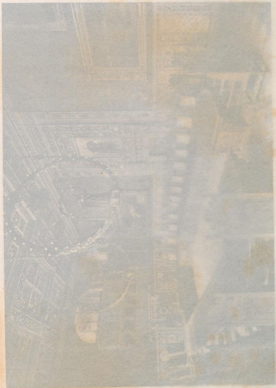
Stabtrorordnetn. Sitzung. Saal.